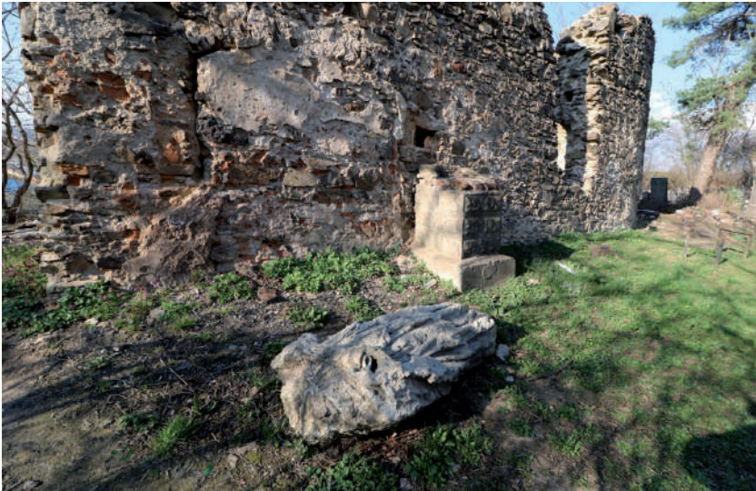
Nepomuki Szent János harmadik szobrának megmaradt része a radvánci templomrom mellett. A szerző felvétele 2019-ből.