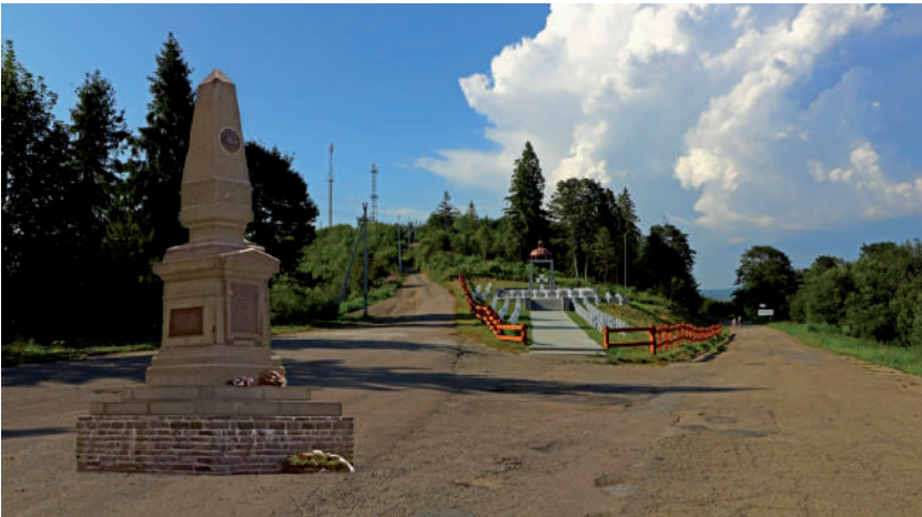
Egy kis segítség az emlékmű eredeti helyének beazonosításához

Megjegyezzük, hogy az emlékmű környékén a háborús időkben magyar honvédeket is temettek el. Egyébként a sírok kialakításakor és a környezet rendezésekor eltüntették a pásztorszobrot, az autóbuszváró épületét, sőt, az 1996-ban a szics-gárdistáknak emelt 1939-es feliratú emlékművet is. A törmelékét ledózerolták és a hágó galíciái oldalába borították. Éppen oda, ahová a millenniumi határkő talapzata is került. Így azt még jobban eltemették. Az így kialakított térségben 2017-ben a Lviv Megyei Államigazgatási Hivatal a Kárpáti Szics 22 katonááldozatának látványos temetőt épített ki. Az emléktemető október 15-i avatásakor, tartva az atrocitásoktól, az újonnan felavatott honfoglalási emlékmű megerősített rendőrségi felügyelet alatt állt.