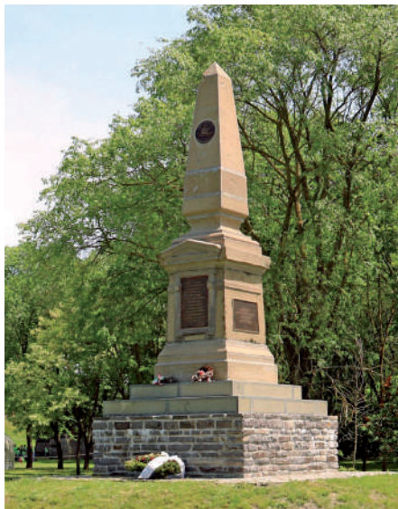
A vereckei emlékmű Ópusztaszeren.

A vereckei emlékművet a 19. századi békeidőkben eleink határkő-emlékműnek szánták. Nem csak a korabeli Bereg vármegye határait, nem csak az ezeréves magyar szállásterületek határait, hanem a magyar sorsot alakító történelmi malomkövek, azaz a kelet-nyugat határát is hivatott volt jelölni a vereckei határkő. A 20. század azonban könnyekkel és vérrel rajzolta át a határokat. Világháborúk, összeomlások és keserves újrakezdések, diadalmas idegen győztesek és mostoha sorsú magyar vesztesek. [...] A vereckei emlékmű további 20. századi sorsában mint cseppben a tenger tükröződik a magyar kiszolgáltatottság. Megcsonkítják, elbontják,