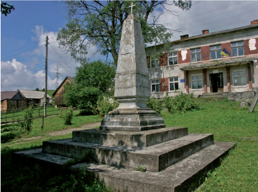
Az emlékmű felső része Tuholkán.

A műemlékvédelmi hivataltól megtudtuk, hogy a zavaros körülmények között felállított oszlopot az Ukrajnában végbement politikai szemléletváltás után, 1993 márciusában, mivel nem sírokra emelt emlékkőről volt szó, törölték a műemlékek nyilvántartásából. A vörös birodalom és az ötágú csillag ködbe veszése után a pentagramos motívumot bevakolták, és a gránitobeliszk tetejébe keresztet állítottak.