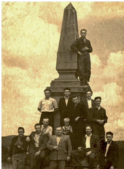
Kárpátaljai zárandokok az emlékműnél 1953-ban.