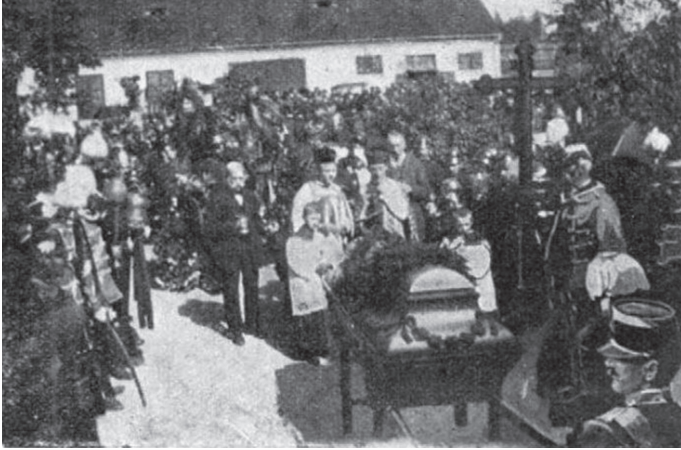
Egán Ede temetése (Új Idők 1901-2)

Egán Ede holttestét az ungvári közpórház 1900-ban épült kápolnájában (ma a megyei kórház területén átépítve előadóterem) ravatalozták fel. A szeptember 22-i búcsúztató gyászszertartás neves közéleti személyiségek és nagyszámú gyászoló részvételével délután 3 órakor kezdődött. Az egyházi búcsúztatást Benkő József római katolikus esperes Sirola Károly káplán közreműködésével végezte. Majd az ungvári daloskör énekelt. Ezután a papnevelő intézet növendékei a koporsót a négylovas gyászkocsira emelték, és azt a tömeg kíséretében a vasútállomásra szállították. Az érckoporsót itt kettős fakoporsóba helyezték. A vonat fél hétkor indult el a vas megyei Borostyánkőre (ma Bernstein, Örvidek, Ausztria), ahol szeptember 24-én a családi sírhelyen helyezték örök nyugalomra.