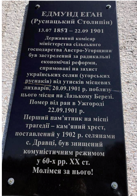
Az emlékmű táblája