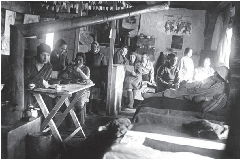
Kényszermunkára elítélt nők barakkja egy GULÁG-táborban.

először 1950. október 14-én halálra ítélték. Két évig gyötrődött a kivégzésre várók siralomházában. Majd a nevezett testület kegyelemben részesítette, 1952. április 18–20-án 25 év szabadságvesztésre ítélte el. A továbbiakban a sorsa nem ismeretes. 1993-ban rehabilitálták.