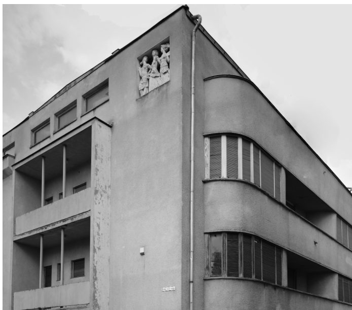
A Schön-villa (1936-37) Temesváron a C. D. Loga és a Michelangelo utcák találkozásában 2024-ben.

saját illusztrációs anyaggal bővített változata is ekkor látott napvilágot. Éppen ez, az építészeti tér forgalmáról szóló írás 14 nyújtja elméletközpontú építészetszemléletének szintézisét. Frankfurti letelepedése után nem sokkal, 1970. augusztus 18-án hunyt el.