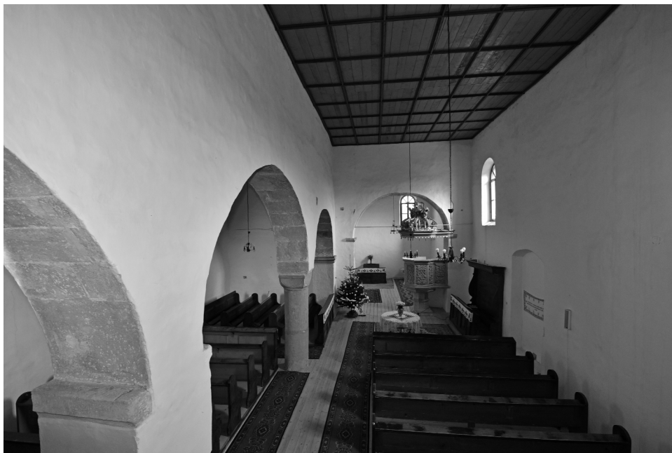
A bonchidai templom kéthajós térképézése és a „bizánci” oszlopfelvezetek

Modernista felfogásban a templom megközelítése és a feltárulkozó látvány is különös jelentőséggel bír. A templomba mindig gyalog megy – az anyja által elő-