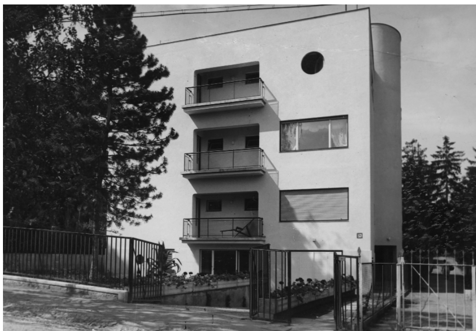
A Reich-ház utcai homlokzata 1937 körül.