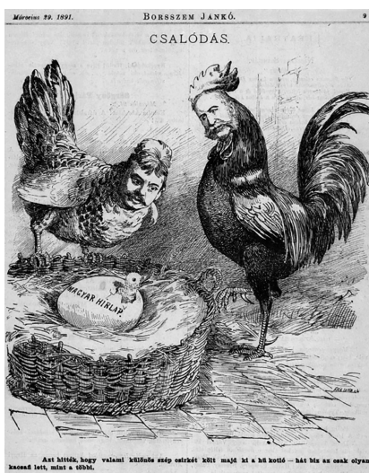
Állatias ábrázolás a Borsszem Jankóban

A két lap ábrázolástechnikai hasonlósága, valamint a nemzetközi hagyományba való beilleszkedés mellett az is igazolja a lapok egymásra gyakorolt hatását, hogy különböző módokon, de reagálnak egymás élclapi mivoltára. A Gura Satului egy teljes oldalban megjelenített karikatúrában említi meg a Borsszem Jankót (3. ábra). A magyar élclap, bár nem karikatúra formájában, de a Szerkesztő Postájában humorral reagál a román élclapban megjelent közleményre: „Fájdalom, nem értettük meg a minden esetre elmés, nemes költeményt; az »Atheneumban« van ugyan aki tud »dákóul« – de »románul« csak az egy Jókai tud; az pedig most nem érkezik, mert busul rajta, hogy dicsérnie kell azt, amit perhorreskál!” 31