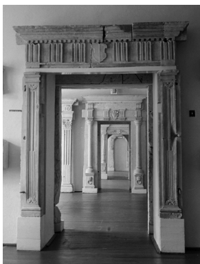
A középkori és kora újkori kőtár 1970–1982 között

A kolozsvári Szent Mihály-plébániatemplom két boltzáróköve közül az egyiket Jézus szimbóluma, a kereszt zászlót tartó Isten báránya dombormű, 48 a második záróköv előlapját tükörben faragott 1498-as évszám felirata díszíti. A tükörfaragás minden valószínűség szerint egy sablont fordítva használó, írástudatlan kőfaragó-