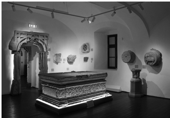
A középkori és kora újkori kőtár 2024-ben (a szerző felvétele)

A Főtér keleti során álló Wolphard–Kakas-ház faragványait a kőtár egyik legszínvonalasabb és legnagyobb tételszámú emlékegyütteseként tartjuk számon. 62 A város egyik legjelentősebb reneszánsz lakóházának faragványai az épület 1894-ben történt, részleges bontását követően kerültek a Múzeum-Egylet gyűjteményébe. A házból összesen ötvennégy kőemlék származik. A több ízben bővített, szépített épület legkorábbi emlékei egykori főhomlokzatának emeleti ablakai, melyek közül kettőt Wolphard Adorján, Kolozsvár utolsó római katolikus plébánosának lófőpajzsba faragott papi címere (1534), a harmadikat a család másik, unokaöccse által is használt, nyilakkal átlőtt szívet ábrázoló címere díszít (1536). A három szé-