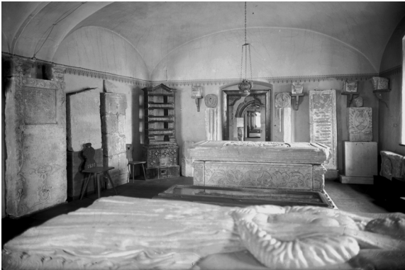
A középkori és kora újkori kőtár 1941-ben