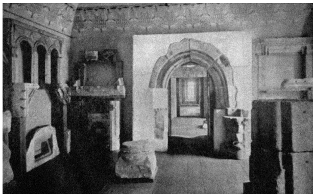
A középkori és kora újkori kőtár a Bástya utcai székhelyén, 1937-ben (Mihail Macrea: Institutul de Studii Clasice. O scurtă prezentare a activităţii și a colecțiilor sale . Gazeta Ilustrată . 1937. VI. évf. 9–10. sz. 118.)

Az első világháború félbeszakította az új kiállítások létrehozásának munkálatait. 1916-ban, Románia hadüzenetét követően az Erdélyi Múzeum-Egyesület gyűjteményeinek nagy részét Budapestre menekítették. Bár nincsenek arra vonatkozó információink, hogy milyen típusú darabokat evakuáltak, feltételezzük, hogy ezek a biztonsági intézkedések nem érintették a múzeum kőtárait. 19