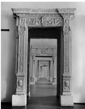
A középkori és kora újkori kőtár 1970–1982 között

Az erdélyi késő reneszánsz síremlékszobrászat egyik legérdekesebb típusa Sükösd György 1632-ben készült szarkofágja, mely eredetileg az egykori nagyteremi református templom szentélyének északi falánál, az elhunyt epifátiama alatt állt. 37 A síremlék egy szarkofágból és egy háromszög alakú timpanonnal lezárt sírfelirattól tevődik össze. A szarkofág fedőlapján az elhunyt páncélba öltöztetett, fekvő alakja, kardja, buzogánya, lábainál pedig két kis méretű, fekvő oroszlán csonkjai láthatók. Az elhunyt testének pihenést sejtető pozícióban való ábrázolása a csendes elszenderedést sejteti. Sükösd György testének anatómiailag helytelen arányai, végtagjainak irreális helyzete viszont enyhén groteszk képet eredmé-