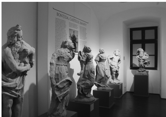
A középkori és kora újkori kőtár 2024-ben (a szerző felvétele)