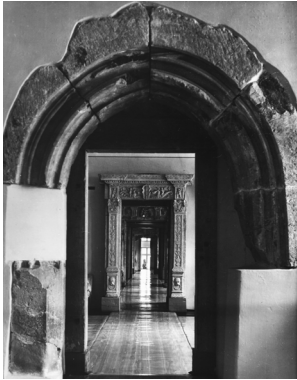
A középkori és kora újkori kőtár 1968-ban