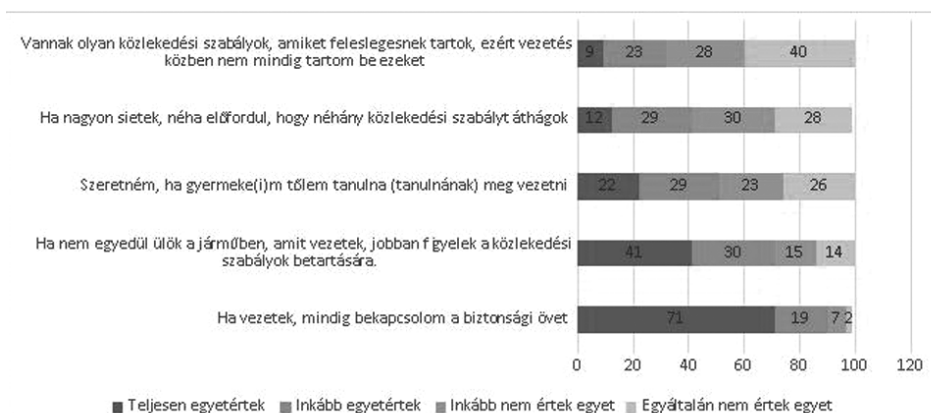
1. ábra. Szabálykövetéssel kapcsolatos attitűdök, szokások a lakosság körében (n = 2500)

lyok áthágására egyes helyzetekben (pl. sietség). Kiemelendő azonban, hogy a válaszadók 71%-a társaságban nagyobb figyelmet fordít a közlekedési szabályok betartására. A válaszadók harmada (32%) azzal is (inkább) egyetértett, hogy bizonyos szabályokat azok vélt feleslegessége miatt nem tart be.