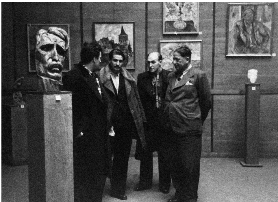
Csoportkép a kolozsvári Múcsarnok 1943-as tárlatán.

Ez az épület a háborús frontátvonulásig olyan nagyszabású tárlatoknak adott helyet, melyekhez hasonlóra sem korábban, sem később nem volt példa. Ezek között említendő a megnyitó kiállítás, mely az erdélyi, illetve az Erdélyből el-