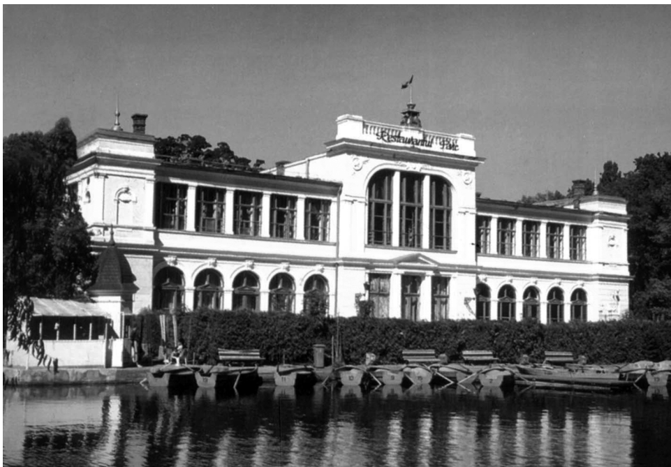
A sétatéri korcsolyacsarnok egy mai felvételen

művész adományozta, aki egyébként az Erdélyrészi Szépművészeti Társaság életre hívásának is kezdeményezője volt. Közben Wlassics Gyula vallás- és közoktatásügyi miniszter 2000 koronát utalt ki számukra.