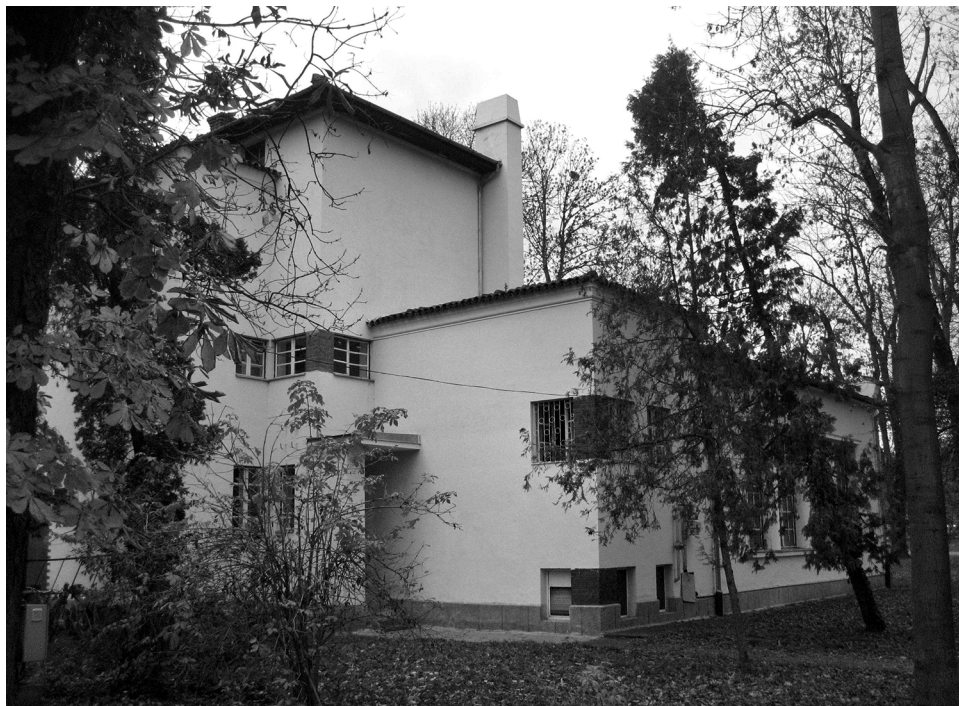
A Múcsarnok egy mai felvételen

A sebtében helyreállított épületben 1947-től szerveztek nagyobb kiállításokat. Később a kolozsvári Képzőművészeti Főiskola vette birtokába az épületet.