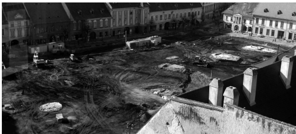
A nagyszébeni Nagypiac ásatása 2005-ben (Rázvan Pop nyomán)

ló ásatások nyomvonalait megkülönböztetett színnel jelölték (a Roland-szobor talapzatát, a Nepomuk-oszlop körvonalait, valamint a Szent László-kápolna alaprajzát). Ez a megoldás ugyan elegáns és non-destruktív, valamint anyagilag kevésbé megterhelő, mint egy kültéri régészeti múzeum vagy in situ bemutatás, sajnos megfelelő tájékoztató anyagok hiányában a turisták számára értelmezhetetlen és láthatatlan.