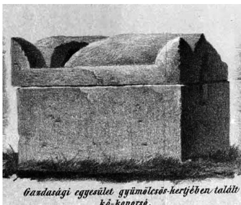
Gazdasági egyesület gyümölcsös-hertjében talált kő-koporsó. Római szarkofág Napoca területéről (Jakab 1870 nyomán)

Hasonlóan fontos, ám kevésbé jól dokumentált régészeti ásatások és felfedezések történtek Kolozsváron is a 19. század második felében. A dualizmus kori város gyors fejlődése és területi expanziója révén a városkép radikálisan megváltozott: a középkori város végérvényesen eltűnt, a még álló reneszánsz épületeket át- vagy újraépítették, többségük helyén pedig új, historizáló lakóházak épültek. Az 1867–1918 között előkerült régészeti emlékek sokasága – különösen a római város emlékeinek felfedezése – sajnos nem lett dokumentálva. 18