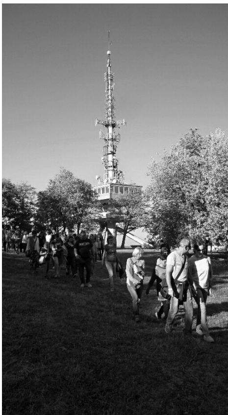
Városi séta az Avason, háttérben a kilátó

semmiféle ideológiai kötöttsége nincsen, és több szempontból világszínvonalú építészeti műremek, melyet kifejezetten negatív képzetek öveztek. Nagyrészt azért kezdtük rendezvényeink jelentős részét oda szervezni, hogy magát a kilátót is népszerűsítsük úgy, hogy az alaptalan és lesajnáló sztereotípiákat le tudjuk rombolni. Több szempontból jelképes az avasi kilátó esete. Az 1963-ban Hofer Miklós tervei alapján épült építészeti-technikai bravúr természetes módon rövid időn belül a város jelképévé vált. Valószínűleg ennek köszönhetette aztán 1990-et követő elhanyagolását is: a városvezetés (és a városlakók egy része) az épületet a szocializmus termékének, jelképének ítélte. 10 A kilátó jól példázza, hogy tehetőséges építések sötét időszakban is tudnak maradandót alkotni. A helykiválasztás tökéletes, semmilyen meglévő épületet nem kellett hozzá lebontani, még a korábbi (elpusztult) kilátó esetleges újjáépítését sem lehetetleníti el, és az avasi templom és harangtorony látványát sem zavarja, sőt inkább gazdagítja. A sziluettje pedig olyan, hogy pár vonallal felismerhető módon visszaadható.