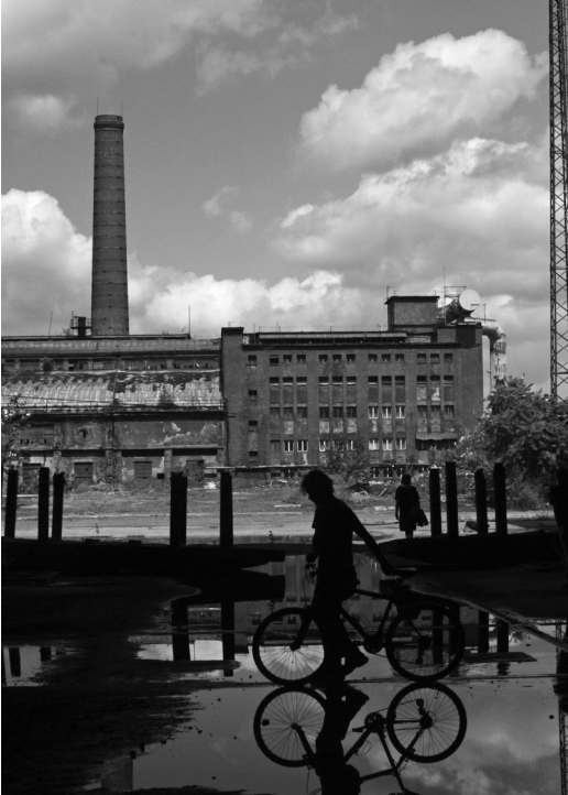
Diósgyőri Acélművek. Kilátás a kombinált acélmű épületéből a keleti erőműre

iket. Az ipar erőltetett felfuttatása tovább duzzasztotta a várost, létrejöttek a hatalmas lakótelepek, nagy arányban a városon kívülről betelepült lakossággal. A háború utáni évek erőltetett modernizációja rengeteg bontással is járt, amit vagy nem követett új építés, vagy ha követett is, többnyire nem vette figyelembe a történeti városszövetet. A nyolcvanas évekre az egész ország szemében Miskolc szürke iparvárossá vált, és maguk a miskolciak is szinte szégyellték, hogy itt élnek. „Miskolc nem szép, de a környéke gyönyörű”, hangzott el minduntalan családi-baráti beszélgetéseken.