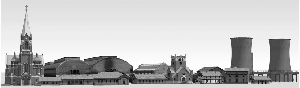
A Diósgyőri Vasgár néhány épületének 3D-s modellje

kori bányásztelepülés megítélését megváltoztatni. Sajnos a vasgár kolóniái (a vasgyári kolónia Diósgyőrben, a bányászkolónia Perecesen) mára valóban nincsenek jó állapotban. Mindkét kolónia középületeinek egy része üresen áll, és pusztul. Archív tervek, fotók felkutatásával (levéltárakban és magángyűjteményekben) mindkét városrész fénykorának elkészítettük a virtuális modelljét, amikre online tanösvényt építettünk ( http://perecsitanosveny.hu , http://www.coninprojekt.org/kiallitas/miskolc/3d-modell-galeria/ ). Ez a munka természetesen még nem lezárt, mert hatalmas a feldolgozandó épületek mennyisége. A diósgyőri kolónia modellezésének legújabb fázisa egy nemzetközi projekthez kapcsolódott, aminek keretében a Miskolchoz sok tekintetben hasonló Rozsnyó ipari épületeiről készített hasonló 3D-s rekonstrukciót a helyi partnerszervezetünk, az OZ Medza. 12