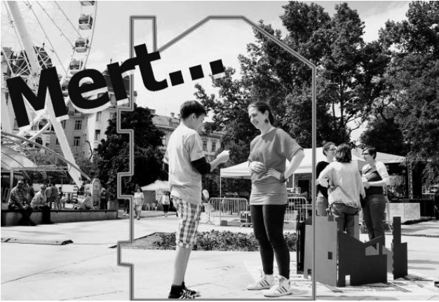
Urbanity. Szerintem azért igen/nem, mert...