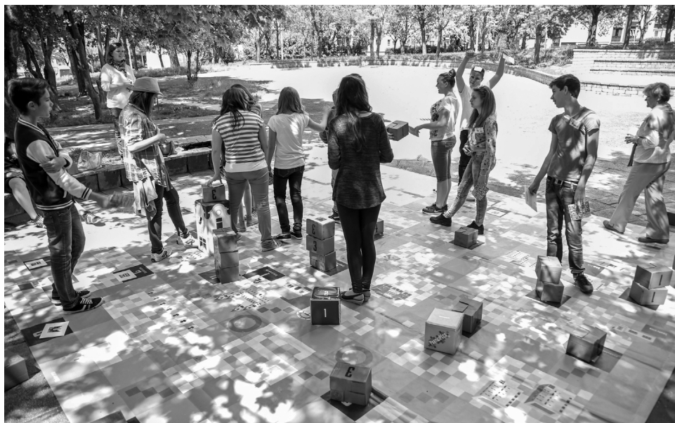
ParticiPécs. Stratégiai élőtársasjáték

projekt keretében, diákokkal együttműködve zajlott Pécsen, így maga a folyamat is alapvető közösségépítő tanulságokkal szolgált minden résztvevő – az egyesület és a gyerekek – számára. Az egyesület alapvetően arra törekedett, hogy új generációs, kooperációs, közös nyereségre irányuló játékményt alakítson ki, és