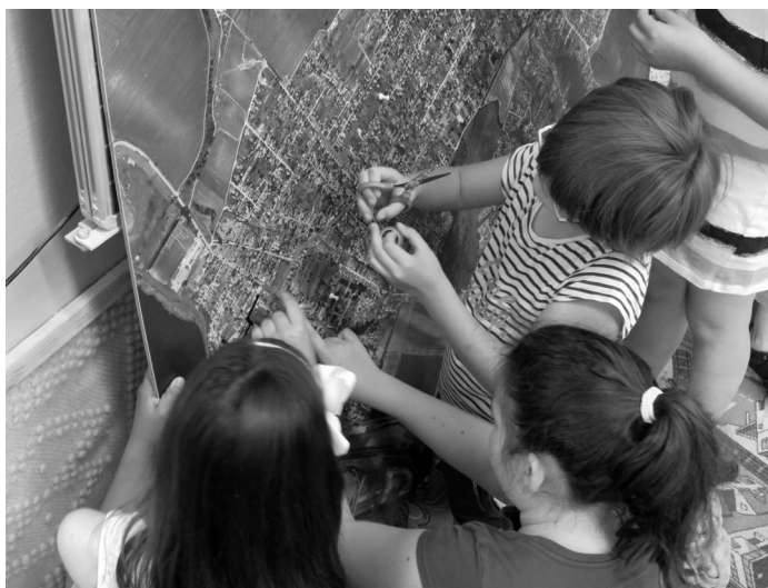
Szubjektív térkép, iskolai foglalkozás

Az építészet azonban mégiscsak szakma, amelynek fogásait hosszú évek tanulása és gyakorlata után tudják a szakemberek biztosan alkalmazni. Abszurd lenne a laikus felhasználóktól elvárni, hogy minden előzetes tudás nélkül megalapozott véleménnyel támogassák az építész munkáját. Különösképp nehéz ez egy olyan generáció esetében, amelyet már egészen zsenge korától autóban szállítanak a szülők sokszor távol eső célpontok között, melyek személyes életének helyszínei. Messze vagyunk már a poros grund világtól, ahol nap mint nap találkoztak a környékbeli gyerekek, akik egyébként mind a közeli utcákban laktak, gyalog baktattak iskolába, gyalog szalajtották őket a boltba, menet közben az ismert köveket rugdosták, bekukkantottak az ismert kapualjakra, és mire felnőttek, a fejükben valóban nem térkép volt a táj, hanem szubjektív valóság. Ezt a „szubjektív térképet” ma iskolai vagy szakköri foglalkozás keretében rajzoltatják meg erre felkészült szakemberek – építészek, pedagógusok, vizuális nevelők. És itt lép a képbe az épített környezeti nevelés, amely tudatos eszközökkel igyekszik az elveszett tudást – az épített környezet és az egyén objektív és szubjektív viszonyát alakító tényezőket – újra a felszínre hozni. Hisz csak akkor válhatunk környezetünk felelős alakítóivá, az építés tervező segítőtársává a folyamatban, ha ismerjük azt, amit formálni akarunk. Némi építészeti alapismeret, egy kis környezetpszichológia, sok-sok érzékszervi