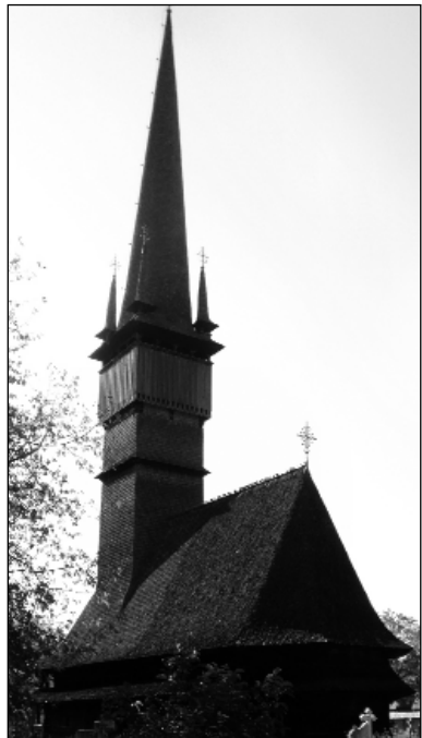
3. Az UNESCO Világörökségi listáján szereplő fatemplom. Dióshalom (Șurdești). Saját felvétel, 2015.

Az erdélyi román fatemplomoknak fő jellegzettsége, hogy a nyugati kereszténység művészetében kialakult formákkal szolgálják a keleti ortodox egyházat. A keleti egyházra jellemző bizánci formák a templomok belső terében, a falfestésben, az egyházi szerek díszítésében hangsúlyosak (2. kép). A történeti stílusok közül a gótika nyomta rá leginkább bélyegét az erdélyi faépítészetre (kúp- és sisakformák, négy fiatorony stb.). Az erdélyi román fatemplomtípus külső megjelenésében nem egységes, követi a magyar faépítészet változásait, ugyanis az egyes mesterek egymástól (is) átvettek elemeket. A jelenleg ismeretes román fatemplomtípus körülbelül a 17. században nyerte el formáját. Alaprajzuk a középkori, főleg gótikus kisebb falusi templomokéra hasonlít (hosszshajós elrendezés, egyenes hat- és nyolcszög alakban záródó szentélyek. Külsőjükre a túlzott magasság jellemző, „törekeny, valószerűtlen arányok, az égbefúródó, vékony sisakformák”. 9 A gótika jegyeit viselő máramarosi fatemplomokra szintén jellemzőek a letisztult formák, magas tornyok. Födémük általában fából készült dongaboltozat, néhányukon tornác is található, belül vastag falak és kicsi sötét belső a jellemző 10 (3. kép).