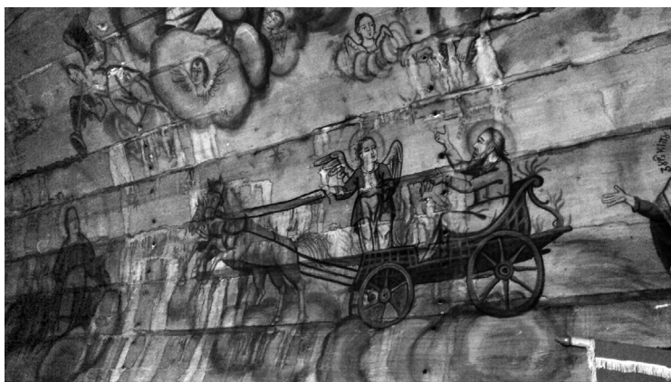
8. Illés szekere. Nyárfás (Plopiș). Saját felvétel, 2015.

A tűzes szekér vagy Illés szekere képtípus (8. kép) szimbolikus jelentéséről Ivan Evseev munkájában a villám szócikk 59 keretében olvashatunk. Narratív megfelelője a következő: „S történt, amint mentek és beszélgettek, egyszer csak jött egy tűzes szekér, tűzes lovakkal, s elválasztotta őket egymástól, aztán Illés a forgószéllal fölment az égbe.” (2 Kir 2, 11) Az Illés tűzes szekerét húzó ló alakját angyallátomásként, égi küldöttként is értelmezik. 60 A szekér jelentéséhez az Úr harci szekere képzetkör tartozik, az Ő hatalmára utal. Lélekvezető funkciója is van, hiszen a szekér által emeli az Úr Illés prófétát a mennyországba. 61