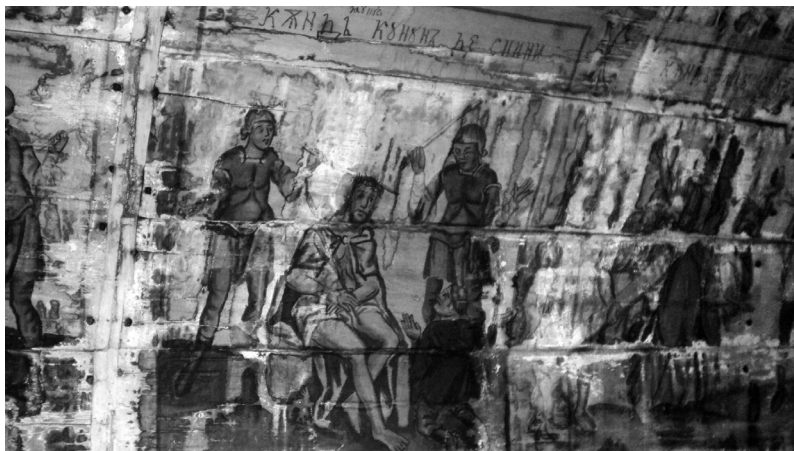
4. Krisztus szenvedéstörténete. Megostorozás. Nyárfás (Plopiș). Saját felvétel, 2015.

Az Ó- és Újszövetség narratívumainak ikonográfiai ábrázolásai párhuzamban vannak egymással. Máramarosban néhány téma felerősödött formában van jelen (pl. Krisztus szenvedéstörténete, keresztrefeszítése stb.– 4. kép), míg mások kevésbé je-