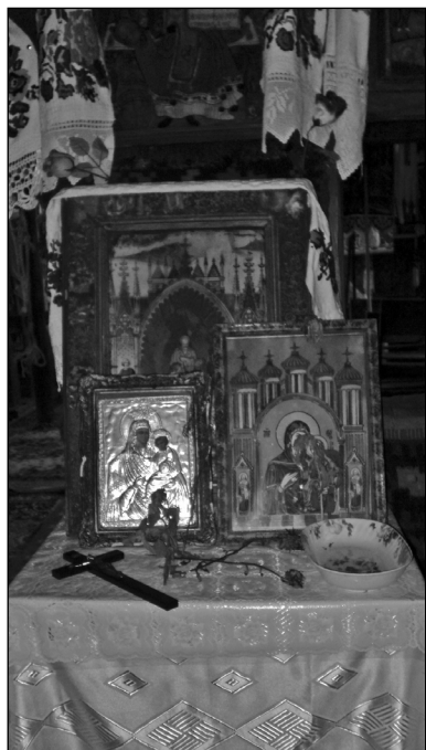
2. Templombelső. Budfalva (Budești). Saját felvétel, 2015.

Az erdélyi román fatemplomoknak fő jellegzettsége, hogy a nyugati kereszténység művészetében kialakult formákkal szolgálják a keleti ortodox egyházat. A keleti egyházra jellemző bizánci formák a templomok belső terében, a falfestésben, az egyházi szerek díszítésében hangsúlyosak (2. kép). A történeti stílusok közül a gótika nyomta rá leginkább bélyegét az erdélyi faépítészetre (kúp- és sisakformák, négy fiatorony stb.). Az erdélyi román fatemplomtípus külső megjelenésében nem egységes, követi a magyar faépítészet változásait, ugyanis az egyes mesterek egymástól (is) átvettek elemeket. A jelenleg ismeretes román fatemplomtípus körülbelül a 17. században nyerte el formáját. Alaprajzuk a középkori, főleg gótikus kisebb falusi templomokéra hasonlít (hosszshajós elrendezés, egyenes hat- és nyolcszög alakban záródó szentélyek. Külsőjükre a túlzott magasság jellemző, „törekeny, valószerűtlen arányok, az égbefúródó, vékony sisakformák”. 9 A gótika jegyeit viselő máramarosi fatemplomokra szintén jellemzőek a letisztult formák, magas tornyok. Födémük általában fából készült dongaboltozat, néhányukon tornác is található, belül vastag falak és kicsi sötét belső a jellemző 10 (3. kép).