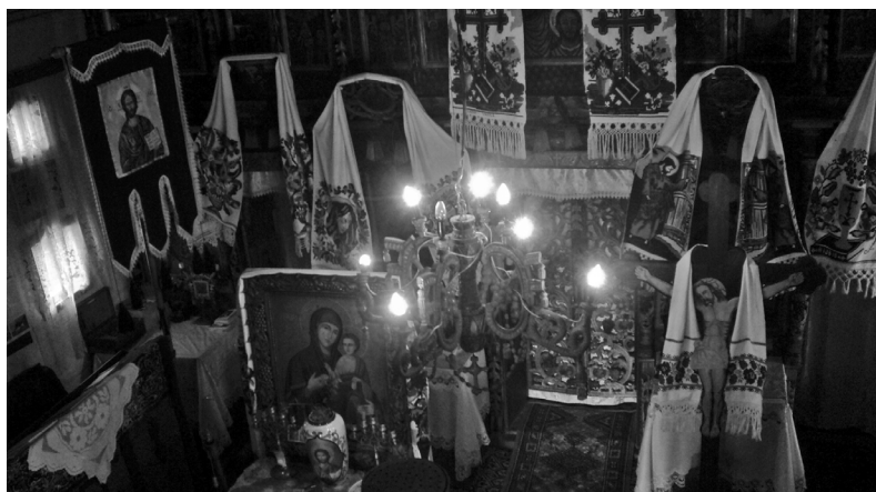
1. Templombelső. Nyárfás (Plopiș). 2015.

A szakirodalom két templomtípust különböztet meg: a nyugati (gót) és keleti (bizánci) stílust. Külalakkjuk eltérő, a gót típusú (egytornyos templom) a román, magyar, német nemzetiségűek körében, míg a bizánci (háromtornyos) a rutének körében terjedt el. A templomok beosztása hármas tagoltságú: szentély, csarnok (hajó), előcsarnok. Mindezek említését azért tartottam fontosnak, mert az egyes ikonográfiai témák funkciójukból adódóan szabályszerűen vannak elhelyezve a templom egyes részeiben. A szentélybe csak a beavatottak léphetnek be, ezt a teret a hajótól az ikonosztáz választja el, amelyet ikonok díszítenek. A csarnok a férfiak részére fenntartott hely, amelynek falai az Ó- és Újszövetség bibliai jeleneteivel (falfestményekkel), kendőkkel, szöttesekkel vannak díszítve (1. kép). Az előcsarnok a nőknek fenntartott helyiség, ahonnan egy áttört boronafalon keresztül szemlélik a liturgiát. 8