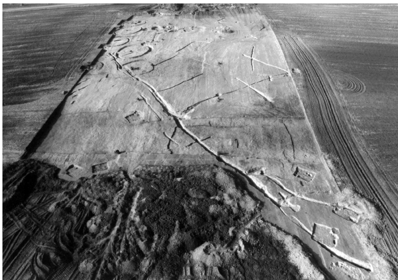
3. kép. A Hajdúdorog – csárdadombi falutelepülés maradványai.

Legkorábbi, 10. századi falvaink cáfolhatatlan bizonyítékait a régészet szolgáltathatja. Sajnos a középkori falvaink feltárása régészetünk egyik legfiatalabb ágazata. 13 Annak ellenére, hogy az elmúlt évtizedekben a beruházásokat megelőző nagy régészeti feltárások igen sok Árpád-kori falutelepülést hoztak napvilágra, biztosan 10. századi településünk igen kevés van. Ennek egyik oka az újabb mentőásatások tetemes részének feldolgozatlansága, másrészt pedig az a körülmény, hogy legkorábbi falvaink területén igen kevés jól keltező lelet kerül napvilágra. Magam 1994-ben az M3-as autópálya akkori (később módosított) nyomvonalán, a Hajdúdorogtól északra lévő Csárdadombon nagyjából egy hektárnyi területen tártam fel kora Árpád-kori falutelepülés részletét. Félig földbe mélyített lakóházak, külső kemencék, műhely maradványai kerültek elő egymástól jelentős távolságra, szórt elrendezésben, ahogyan ez a hasonló korú településeken szokásos. E falu kezdete kétségkívül a 10. századra nyúlik vissza, a legkésőbbi objektumok pedig a 11. század végére vagy a 12. század elejére keltezhetők. A magasból készített fényképfelvételen jól látszik, hogy a házak gödrei közelében négyszögletes alakzatokat alkotó árkok vannak, amelyeket egy ké-