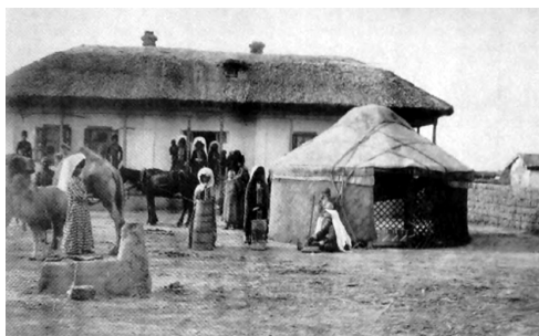
4. kép. Megtelepült nogaj pásztor falusi háza.

Legkorábbi falvaink képe tehát még erősen emlékeztet a nomád szállásokéra, amelyeken az élet is hasonlóképpen folyt, de ez már nem ideiglenes, hanem állandó település volt. A gazdálkodás is eléggé külterjes volt, de az állatállomány olyan egyedekkel bővült, mint a sertés és a házi szárnyas, amelyeket a nomádok soha nem tartanak. E korai falvaink szerkezete, építményei igen hasonlóak a Don-vidéki, az egykori levédiai és etelközi településekre, mint ahogyan a lakóik által használt edények is. A könnyűszerkezetes építmények, sátrak alakjára viszont csak következtetni tudunk. Az egész eurázsiai pusztai övezetben egészen a 20. századig általános gyakorlat volt, hogy a megtelepült nomádok sokáig megőrizték a kényelmes, könnyen összerakható, szellős és szép szőnyegekkel díszített nemezsátrat. Így volt ez az oroszországi nogajoknál is, akik falusi házuk udvarán szintén felállították a régi időkre emlékeztető rácsos szerkezetű nemezsátrukat, ott fogadták a vendégeket, ott időztek velük (4. kép). Hasonló szokások élhettek a mi őseinknél is, még hosszú ideig a megtelepedés után. Nem véletlen tehát, hogy Ottó freisingi püspök, aki 1147 nyarán III. Konrád német király kíséretében utazott át Magyarországon, azt írja, hogy a magyarok „[...] az egész nyarat és őszt sátrak alatt töltik”. 15 (A német uralkodó a második kereszties hadjárat keretében hatalmas sereget vezetett ekkor a Szentföldre.)