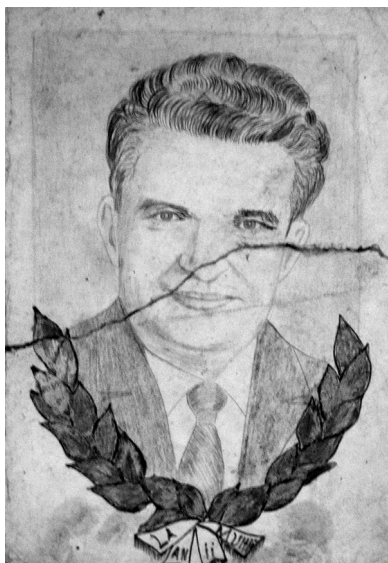
2. illusztráció. Ceaușescu utolsó portréja

Univerzális, mindent hasznosító és újrahasznosító anyag- és eszközhasználat jellemzi művészetét, mely a paraszti értékrenddel szintén konvergál. K. Zs. fest papírra, (általában maga szötte) vászonra, „plakázásra” (borítólemeze, faburkolatra), fémlemeze, könyvfedélre, zsírosláda fedelére (általánosan fára), kőre, üvegre; rajzol bármilyen fajtájú papírra, az újságlap szélétől a kockás füzetlapon át egészen a legkisebb papírfecnikig (például fagyaltospapír). Bizonyos szerzők a naiv művészek technikai tudásának hiányára hivatkoznak, én sokkal inkább a rendkívül inventív és kísérletező természetre hívnám fel a figyelmet. K. Zs. olajfestészetét például olyan sajátos anyagfelhasználások jellemzik, mint a gázolajjal („motorinával”), napraforgó- vagy lenolajjal való festés; de olyan új technikákat is kikísérletezett, mint a frissen festett kép kukoricaliszttel („máléliszttel”) és poronddal 33 való beszitálása, ami érdekesen rücskös felületet kölcsönöz a festménynek, vagy a porrá zúzott üveg használata a csillagos égbolt ábrázolására, továbbá egyéni színek (mint például a „bársonszín”) kikeverése vagy olyan természetes növények felhasználása, mint a kék színt adó kékiringó, a piros színt adó pipacs vagy a zöld színt adó fű.