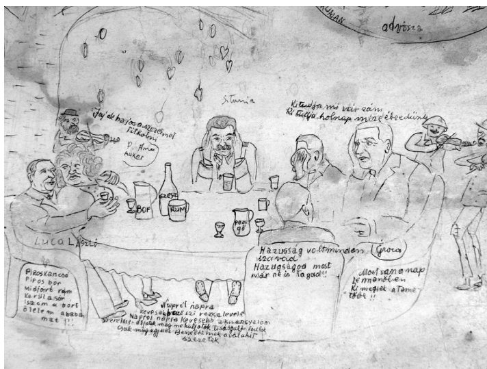
10. illusztráció. Most van a nap lemenőben – politikusok egy asztalnál (1950)

Lehetne még sorolni a példákat, de végtére is számtalan eset kritikai felülvizsgálatra szólít: azon állítást kérdőjelezzik meg, miszerint a naiv művész minden kritikai és esztétikai cél megfogalmazása nélkül alkot. Hiszen igenis megfogalmazódik egyfajta esztétikai ideál (és kritika is, ha úgy tetszik), ami nem merül ki a dolgok pusztá realista ábrázolásában, hanem egy saját belső világrendet teremt meg, ami konkrétan a dolgok megszépítésében, megjobbításában vagy „helyre rakásában” érhető tetten.