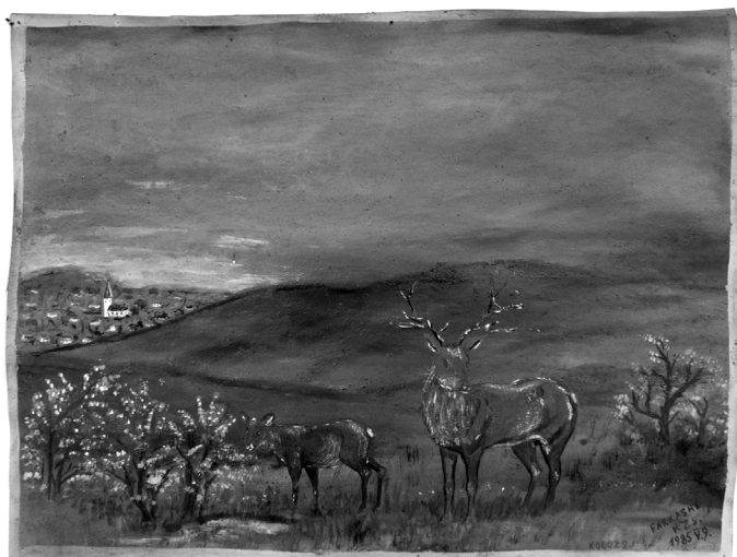
8. illusztráció. Messze falu, kicsiny templom (1985)

en újra és újra ugyanazzal a beállítással lehet találkozni. A felületes megfigyelő könnyen hagyatkozhatna itt is a naivok kapcsán többször leírt valóság-hű ábrázolásra és utánzásra való hajlamra. Egy kép kapcsán azonban K. Zs. a következő gondolatokat fogalmazta meg nagyon világosan szarvasábrázolásairól: „Eztet megint csak olyan elképzelésből. [...] láttam, hogy szép, és meghagytam. A szarvas és ott a gazba az őzike, a szarvas az mindég figyel, és az vigyáz az őzre, éppég úgy van, mint mikor van egy kotló vagy csirke, és a kotló állandóan figyel.” Miről is van itt szó? A képekből világosan kiolvasható, hogy a patakából ivó őz és az azt mindig éber tekintettel őrző hímszarvas – a háziállatoknál is pontosan megfigyelt viselkedés analógiájára – valójában azt a közösségi normát tükrözi (valószínűleg nem tudatosan), mely szerint a mi közösségeinkben is a férfi az, akinek védelmet kell biztosítania a nő számára (8. illusztráció). Fordított szerepekben (bizonyára nem vé-