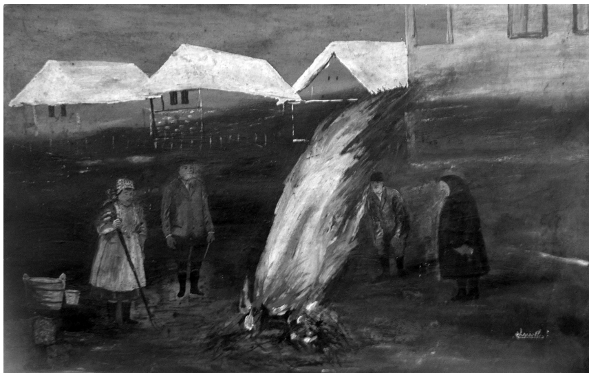
9. illusztráció. Disznóvágás, Kolozs

en újra és újra ugyanazzal a beállítással lehet találkozni. A felületes megfigyelő könnyen hagyatkozhatna itt is a naivok kapcsán többször leírt valóság-hű ábrázolásra és utánzásra való hajlamra. Egy kép kapcsán azonban K. Zs. a következő gondolatokat fogalmazta meg nagyon világosan szarvasábrázolásairól: „Eztet megint csak olyan elképzelésből. [...] láttam, hogy szép, és meghagytam. A szarvas és ott a gazba az őzike, a szarvas az mindég figyel, és az vigyáz az őzre, éppég úgy van, mint mikor van egy kotló vagy csirke, és a kotló állandóan figyel.” Miről is van itt szó? A képekből világosan kiolvasható, hogy a patakából ivó őz és az azt mindig éber tekintettel őrző hímszarvas – a háziállatoknál is pontosan megfigyelt viselkedés analógiájára – valójában azt a közösségi normát tükrözi (valószínűleg nem tudatosan), mely szerint a mi közösségeinkben is a férfi az, akinek védelmet kell biztosítania a nő számára (8. illusztráció). Fordított szerepekben (bizonyára nem vé-