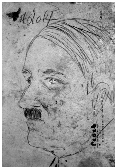
1. illusztráció. Adolf Hitler