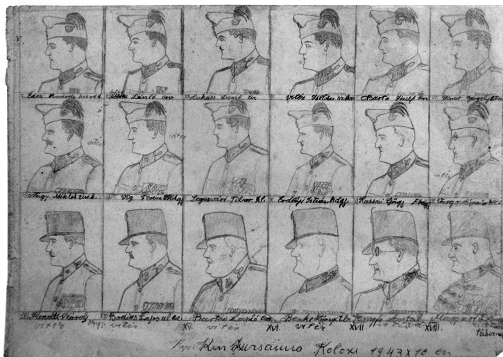
3. illusztráció . Rangsorolt magyar katonák (1943)

A katonaság iránt tanúsított tekintélytisztelet nagyrészt a háborús évekhez nyúl vissza. Itt azonban egy olyan képre szeretném felhívni a figyelmet, amely nemcsak a feltétlen tisztelet kifejeződésének a jele, de a paraszti erkölcsi normák önkéntelen képi kivételése is, ezért mindenképp kitüntetett figyelmet érdemel. A hivatkozott rajzon (3. illusztráció ) a „magyar világban” (1940–1944) Kolozson szolgálatot teljesítő magyar katonák vannak megjelenítve, akiket akkurátus módon, a legkisebb kato-