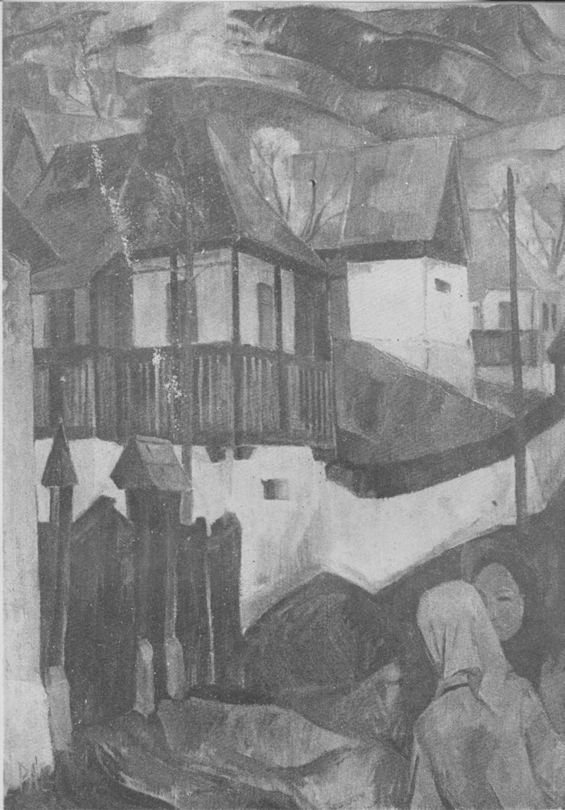
PÁLL LAJOS: 1. IGAZAD VAN 2. AKACFÁK