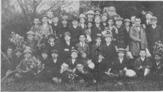
Kiránduláson tanítványaival Kolozsvár környékén, az I. világháború előtt (hátsó sorban jobbról a második, kalapban)