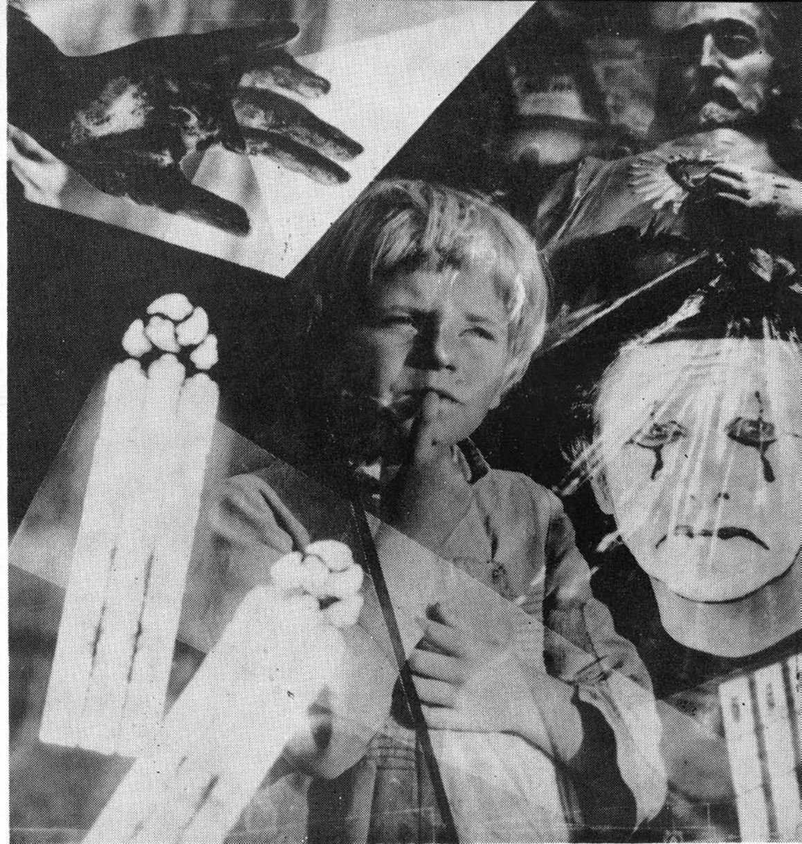
WEISS ISTVÁN: 1. A FELISMERÉSEK CÍMŰ SOROZATBÓL 2. A CSALÓDÁSOK CÍMŰ SOROZATBÓL