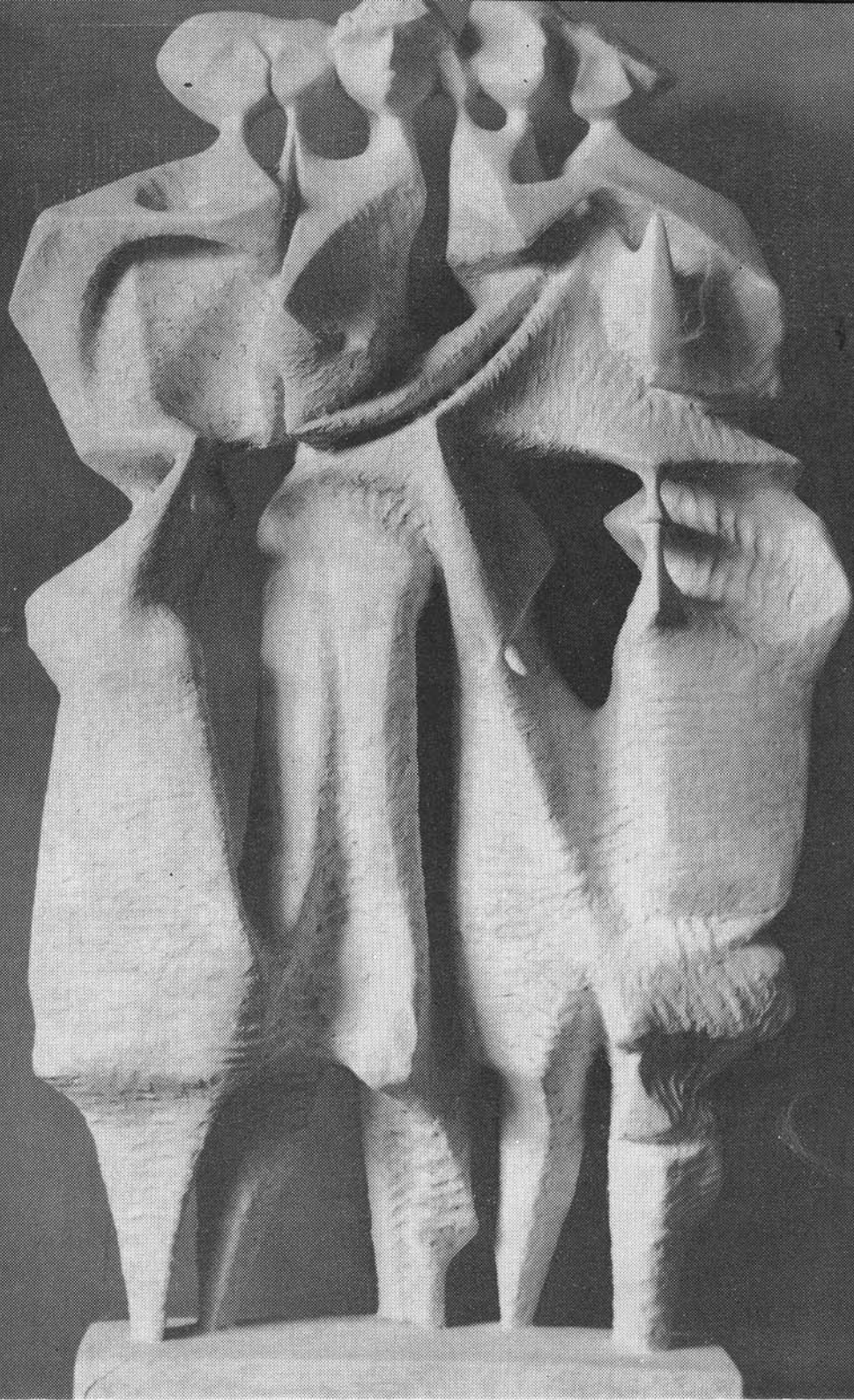
BALOGH PÉTER: 1. EPOSZ 2. BIHAR