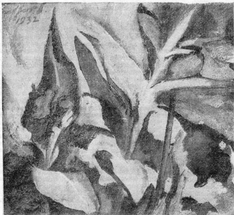
Ziffer Sándor: Csendélet (1932)

* * * Miért bukott meg a Barabás Miklós Céh? Az Írás [Nagyvárad], 1932. 3. — Szolnay Sándor levele Bánffy Miklóshoz (1934) — Kováts József: Haldokló képzőművészetünkért . Ellenzék, 1934. augusztus 5. — Kéki Béla: Az erdélyi képzőművészet gondja . Keleti Újság, 1935. január 20. — A Barabás Miklós Céh erdélyi képzőművészeti tárlata — 1937 (katalógus) — * * * Képzőművészeink Budapesten . Keleti Újság, 1937. április 23. — Kovács László: Tizenegy művész... Pásztortűz , 1937. április 30. — * * * Tizenegy transzilvániai festő, grafikus és szobrász közös kiállítása a magyar fővárosban . Széphalom [Kolozsvár], 1937. 1—2. — * * * A Helikon hírei . Erdélyi Helikon, 1937. 5. — Lyka Károly: Erdélyi művészek kiállítása Budapesten . Pesti Hírlap, 1937. május 2. — Dömötör István: Kiállítások . Napkelet [Budapest], 1937. 415. — Dési Huber István: Az erdélyi képzőművészek budapesti kiállításának margójára . Korunk, 1937. 6. — Szentimrei Jenő: Mostoha gyermekünk a képzőművészet . Brassói Lapok, 1937. június 13. — Nagy Zoltán: Erdélyi képzőművészek Budapesten . Pásztortűz, 1937. 11—12. — * * * Nem volt anyagi sikere az erdélyi művészek budapesti kiállításának . Keleti Újság, 1937. június 16. — Kováts József: Olaszországból jött és Konstantinápolyba megy Gy. Szabó Béla, a kiváló kolozsvári rajzolóművész . Keleti Újság, 1937. augusztus 3. — Heszke Béla: Európai és Ardeal-i festőművészet . Vasárnap [Arad], 1937. szeptember 12. — Venczel József: Művelődéspolitikai terv . Hitel, 1939. 1.