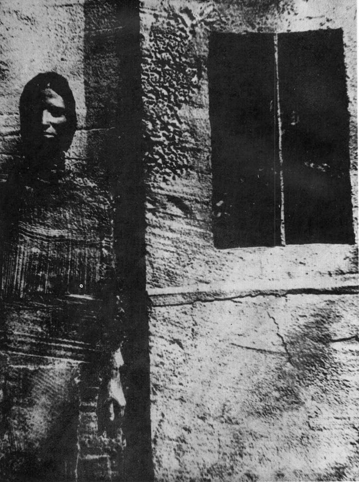
SCHAÁR ERZSÉBET: KINN ÉS BENN