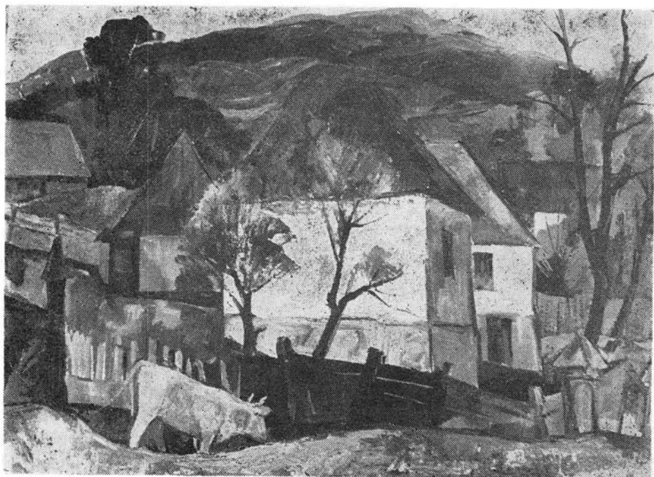
Pál Lajos: Korond