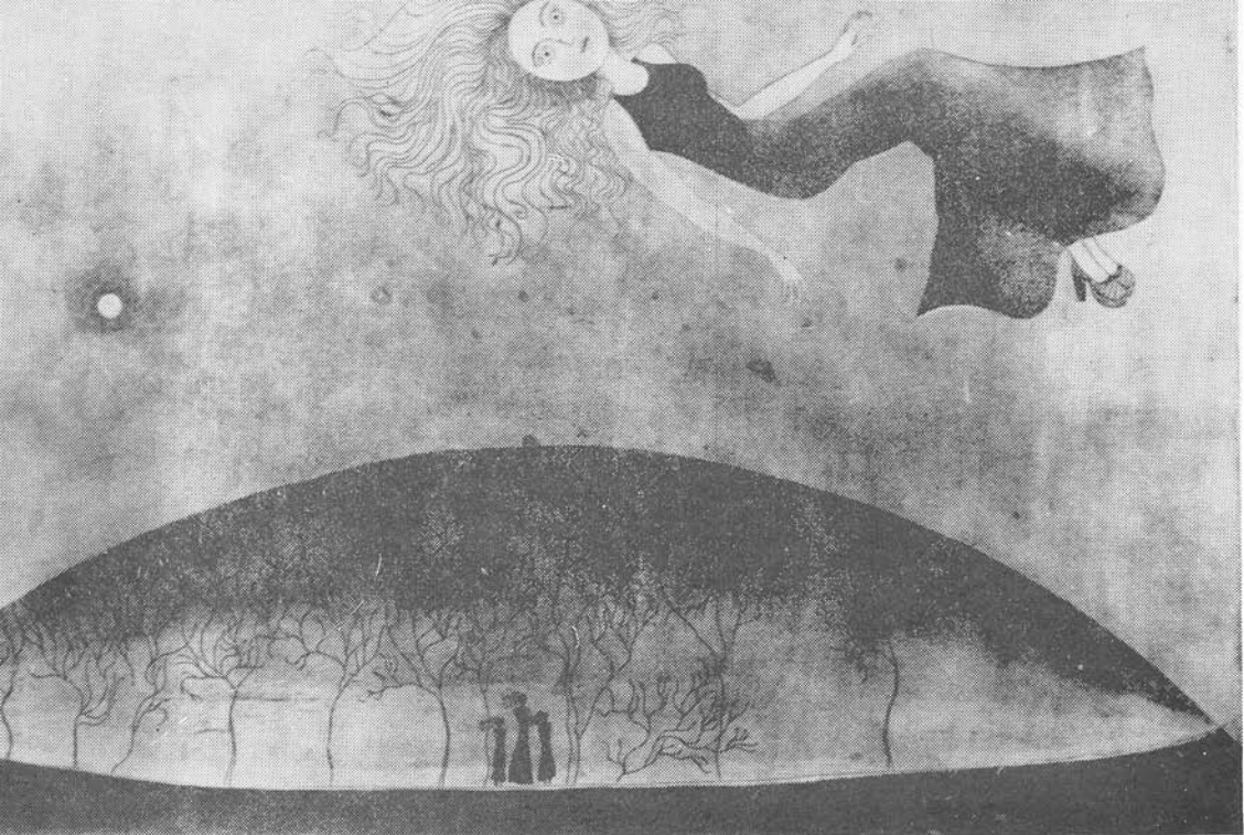
KOPACZ MÁRIA: 1. ESTI SÉTAK, 2. A FÖLDRESZALLÁS PILLANATA