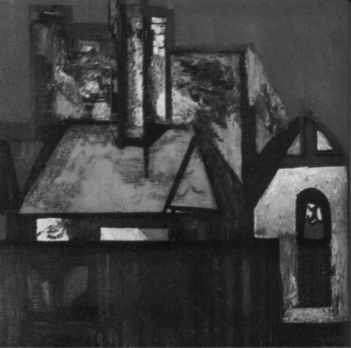
TÓTH LÁSZLÓ: HÁZAK