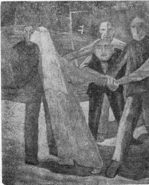
Balla József: A múzsa