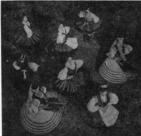
A marosvásárhelyi népi együttes táncsoportja

A tánc évezredek művészete. „Kimért mozgása, fordulatai és körei, szökellései és hátrahajlásai másoknak szép látványt tudnak nyújtani ugyanakkor, amikor maguknak, akik e mozgásokat végzik, az egészségére szolgálnak. A magam részéről minden testgyakorlás közül is ezt mondanám a legszebbnek és a legritmikusabbnak, hiszen a testet lággyá és hajlékonyá és könnyűvé teszi, s megtanítja arra, hogy minden változásra képes legyen, a test erejét sem kis mértékben gyarapítja. Hogyne volna hát minden tekintetben tökéletes valami a tánc, ha tűzbe hozza a lelket, de edzi a testet is, s egyszersmind azokat is, akik nézik, eltölti gyönyörűséggel.“ Elámulva olvasom Lukianosznak, a nagy görög bölcselőnek csaknem kétezer évvel ezelőtt írott sorait, s mai vitáinkra gondolok. Kétségtelenül bőven van miről vitáznunk. De végre tenni is kellene már valamit!