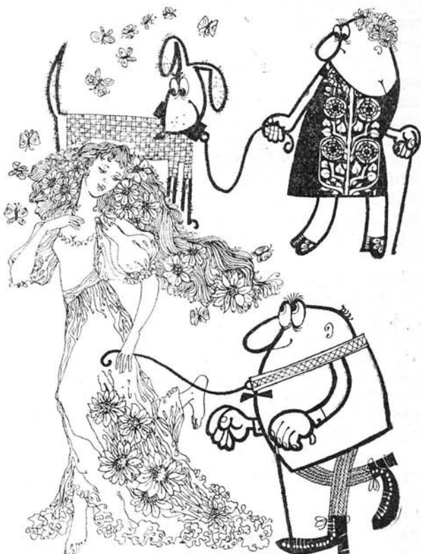
Unipán Helga illusztrációi

ereje azonban éppen törékenységében, gyengeségében rejlik. A nők a felesleges kilók ellen kíméletlenebb harcot folytatnak, mint a férfiak. Amikor tornásznak, mellőzik az izomfejlesztő gyakorlatokat, főként azokat, amelyek a felsőkart erősítik. A „nőiesség“ egyértelmű a gyenge, törekény külsővel. Az eszményinek mondott női test az, amely gyakorlatilag nem nagyon felel meg világunk nehéz munkakövetelményeinek, amely mindig csak „védelmet“ igényel. A férfiaktól eltérően a nők nem fejlesztik testüket. Miután a nő teste a serdülőkor utolsó szakaszában elnyerte szexuálisan vonzó formáját, negatívan ítélik meg minden további fejlődését. A nőt felelőtlennek tartják, ha azt teszi, ami a férfi esetében normálisnak minősül: külseje alakulását a sorsra bízva. Zsenge leánykorukban állnak a legközelebb ahhoz, amilyenek mindig elképzelik eszményi külsejüket: kecses alak, jó tónusú sima bőr, gyenge izomzat, kecses mozdulatok. Feladatuk: megkísérelni a lehető leghosszabb ideig megőrizni ezt a képet. Tökéletesítése nem célszerű. Testüket egyidejűleg óvják a rugalmasság elvesztésétől, az elnehezedéstől, a zsírpárnák lerakódásától. Konzerválják magukat. (Talán a modern társadalmakban élő nők a férfiakénál konzervatívabb politikai beállítottságának magyarázata abban a konzervativizmusban rejlik, amellyel saját testükhöz viszonyulnak.)