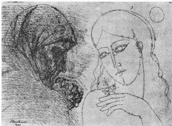
Ambrus Imre grafikája

Részletek a Saturday Review LV. 39. számában megjelent esszéből.