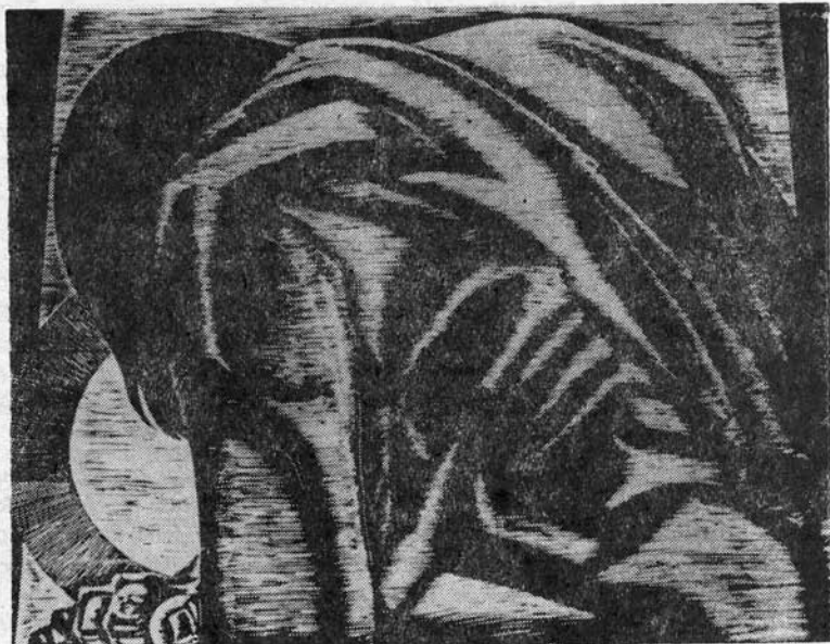
Szabó Gyula: Gond

bekerült az apai műhelybe, szakadatlanul képezte magát. Szakadatlanul, a szó legigazibb értelmében, mert egész élete az új ismeretszerzésben és az alkotásban égett el. Hihetetlen biológiai atommáglyaként működött, csaknem váratlanul bekövetkezett haláláig. Saját életéből szerzett tapasztalata alapján mondotta: „tévedés az, mikor a nagy művészeket nagy bohémeknek is tartják, mert a nagy művésztől mi sem idegenebb, mint a bohémiség. Nem marad sem idő, sem erő a bohémkodásra, mert minden napért keservesen kell megküzdeni, mert a nagysághoz vezető utat a kitartó szorgalom és a hithez való hűség építi.“ És a kitartó szorgalom, mely nála a prófétai megszállottság szintjén hatott. Hányszor örölte fel idegzetét, túlfinomult érzékszervei hány-szor telítődtek pattanásig a világból beáramló információkkal? 1936-ban egész az öngyilkosság határáig jutott, megsemmisítve addigi munkáinak legnagyobb részét. De alighogy felépült, újra munkához látott, és egy év leforgása alatt már Pozsonyban rendezett kiállítást a Masaryk Akadémia és a pozsonyi Magyar Tudományos és Művészeti Társaság támogatásával. Innen jutott 1937-ben szinte egyenesen Párizsba, ahonnan 1938-ban a háborús viszonyok miatt mint hontalant hazakényszerítették.