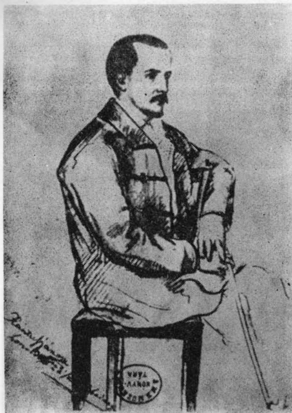
Xántus János 1849 nyarán, Königrätzben