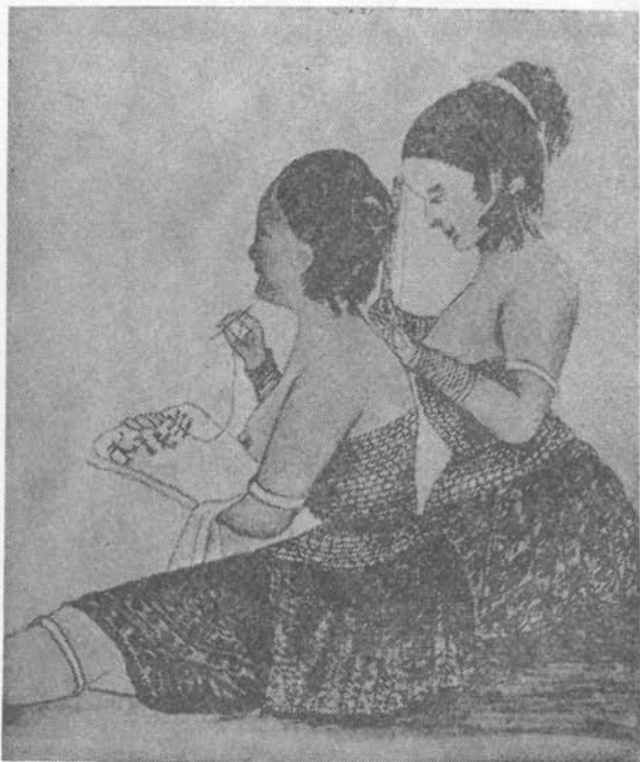
Xántus János festménye

Huszonhárom éves, amikor kitör a forradalom. 1848. május 25-én bevonul nemzetőrnek, szeptemberben tüzerként harcolja végig a pákozdi csatát, 1849-ben Komárom felderítése közben az osztrákok elfogják. Szabadulás, szökés, németországi út, szervezkedés, majd újabb hazatérés és ismét fogság következik. A prágai börtönbe kerül, de innen szintén sikerül megszöknie. Londonba menekül, itt részese az emigránsok reményeinek és reménytelenségeinek. Kapcsolatba kerül az európai demokratikus és szabadságmozgalmak képviselőivel, sőt egyes források szerint Marx Károllyal is. 1852-ben régi szándékát valóra váltva útnak indul Amerikába: New York, Washington, majd Saint-Louis az út állomásai. A szerveződé és ököljogra alapozó világban nehezen találja meg a helyét a romantikus, hűmán műveltségű Xántus János.