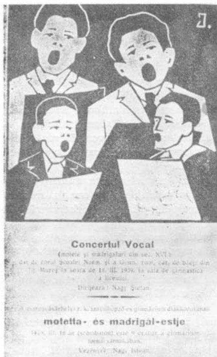
Madrigál-hangverseny plakátja (Marosvásárhely, 1939)

tón foglalkozott a korabeli sajtó. Legjellemzőbb a sok méltató cikk közül azoknak a véleménye, akik a Nagy István előadta művek partitúráinak kiadását gondozták. Kerényi György a következőket írja ( Énekszó : Budapest, 1939. április), miután felsorolja a bemutatott műveket: „Ezek a mi Nyugati Kórusok című gyűjteményünk kiválóbb darabjai. Arról ábrándoztunk, hogy majd egyszer [...] a Palestrina kórus vagy a Székesfővárosi Énekkar rendez ünnepi bemutatóestet ezekből a remekművekből. S íme, mindezeket megelőzve a kis vidéki város [...] Marosvásárhely kicsiny (25 tagú) diák-énekkara küldi el a bemutató híret! Nagy Istvánt a helybeli újság a legnagyobb karvezetők mellé állítja, s működését új korszak kezdetének nevezi... A marosvásárhelyi közönségről nem mondhat nagyobb dicséretet, mint hogy Lasso, Vittoria, Palestrina, Monteverdi műveit megismételtette.”