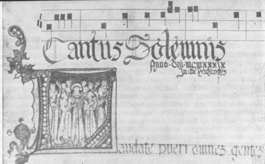
Madrigál-hangverseny plakátja (Kolozsvár, 1939)