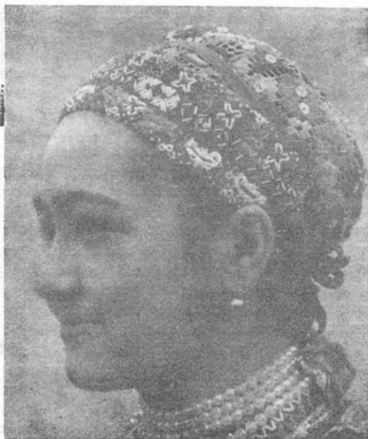
Vistai „fejkötő“