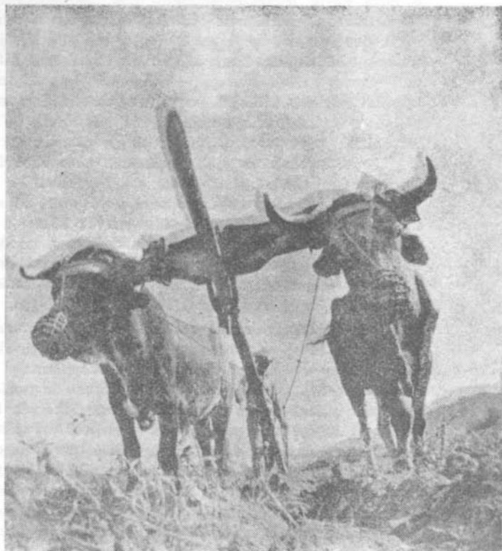
A földművesek 50%-a Mexikó termésének 4%-át szorgálatja

Az emberiség élelmezésében a két legfontosabb növény még mindig a rizs és a búza. Magától értetődő, hogy a legkülönbözőbb nemzetközi élelmezési és mezőgazdasági szervek (például a FAO), alapítványok, növénynemesítő intézmények figyelme ezek felé fordul; az immár láncreakcióként ható demográfiai robbanások sürgető parancsa e két növény hozamainak gyors növelését tette szükségessé. És ez — bizonyos mértékig — sikerült is. Sikerült olyan kiváló új fajtákat előállítani, ame-