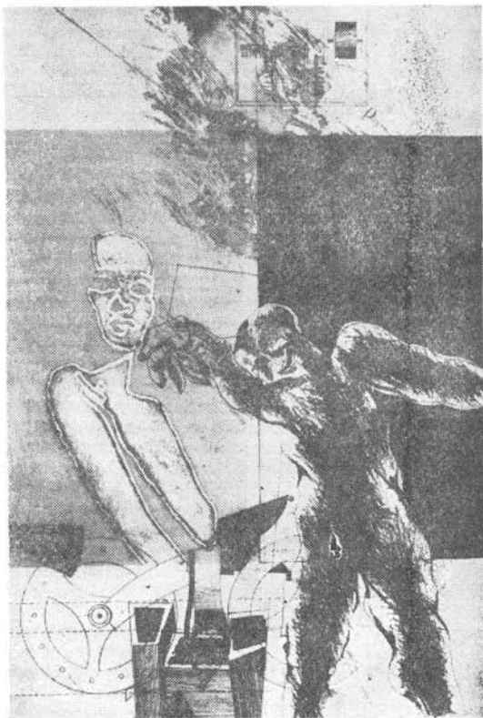
Baász Imre: Közöny