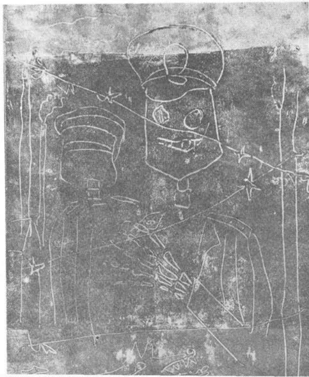
Gedeon Zoltán grafikája