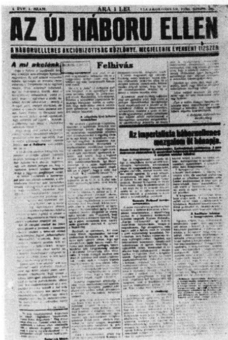
A háborúellenes akcióbizottság közlönye

Maga Romain Rolland betegsége miatt távol maradt, de levelében hangsúlyozta, hogy meg kell bélyegezni mindazokat a kormányokat, amelyek a közvéleményt a kongresszus ellen uszítják... Az imperialista kormányok ugyanis — amint ez hamar kiderült — összefogtak, hogy a kongresszust megakadályozzák. Nyomásukra — s ennek nem is kellett nagyra lennie — a svájci kormány az