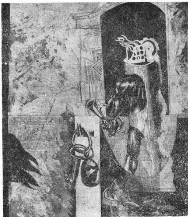
Baász Imre: Gyűjtőgató