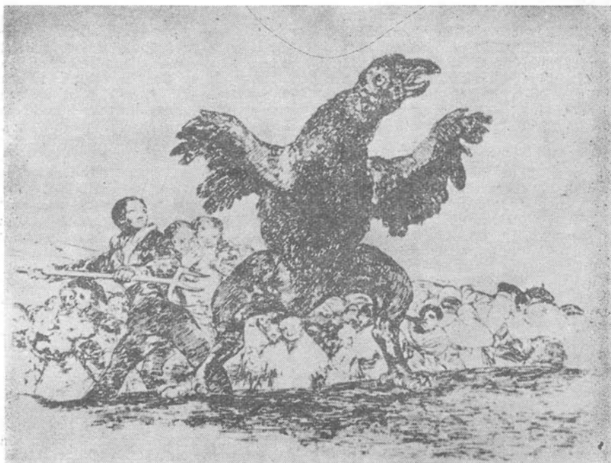
Goya: A háború borzalmai című ciklusból

nátus ratifikálta őket, és a háborús bűnök nürnbergi és tokiói törvényszékein megállapított nagy alapelvekig. E törvények kimondják, hogy még a háborúban sem megengedett minden ütés, hogy vannak korlátai annak is, amivel a hadviselő az emberiséget sújthatja.