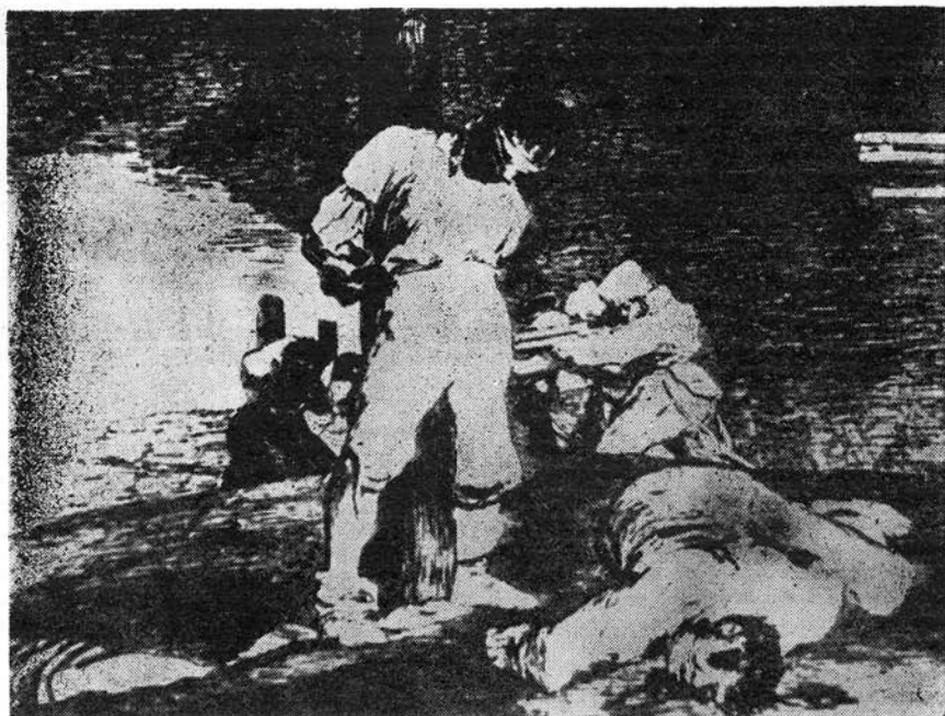
Goya: A háború borzalmai című ciklusból

ba került a bomba áldozataival és a nukleáris emberirtás növekvő, világméretű veszélyével.