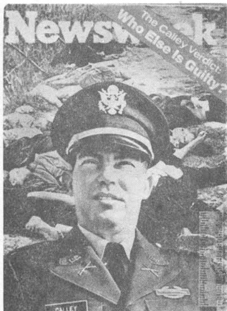
Calley hadnagy (a Newsweek című amerikai folyóirat címlapja)

dők táborába.) Magatartása viszont, amellyel szembefordult az általános felelőtlenséggel s a közömbösséggel, noha ő csak „együtt-cselekedett“ (Heller Ágnes), a kapott parancs szerint, az atomkorszak új humanista etikájának gyakorlati kiindulópontjaként fog a történelemben bekerülni. Példájában joggal köszöntötte az emberiség reményét az a Günther Anders, aki Eatherly „ideológusaként“ elvi síkon fogalmazta meg Hiroshima tanulságát. Ennek az osztrák humanistának köszönhetjük annak tudatosodását, hogy az atomháború arányai meghaladják fantáziánkat, az atombomba pedig az az eszköz, amelynek funkciója a fel nem használás. Alkalmazása esetén az emberiség pusztulásával ugyanis megsemmisülne bármilyen cél. Günther Anders az elsők között mutatott rá arra, hogy a nukleáris fegyverek betiltása csak félmegoldás. A követelmény egy olyan társadalom megteremtése, amely a háború kiiktatásával feleslegessé teszi magát a bombát ( Die Antiquiertheit des Menschen , 1956).