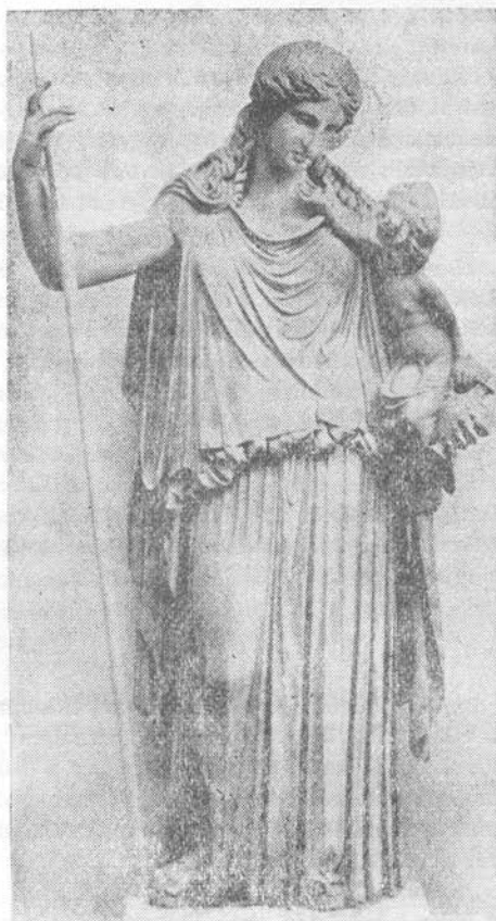
Gemma Augustea — a Pax augustea szimbóluma

Az első görög irodalmi alkotások, a homéroszi eposzok, az Iliász és az Odüsszeia, az osztálytársadalom küszöbére eljutó görög törzsek erőtlől duzzadó, viharos tavaszát, az ún. katonai demokrácia korát mutatják be. Ez a korszak az, amikor a társadalom legfőbb tevékenysége a háború, elismert erényei a vitézség, bátorság és a küzdeni akarás. A háborús magatartást a kölesönös bosszú irányítja, mely véért vért, életért életet kíván. A háború célja: a meggazdagodás, a zsákmány és a rabszolga. A hadviselés vastörvényei még nem engedik felszínre törni a békevágyat, a kompromisszumos elintézt. A megbékélés lehetetlen. Hektórbán egy pillanatra felmerül a gondolat, hogy leteszi köldökkel-domború pajzsát, falhoz támasztja erős sisakját és dárdáját s felajánl mindent a görögöknek, megosztja velük Trója minden kincsét a béke ellenében: