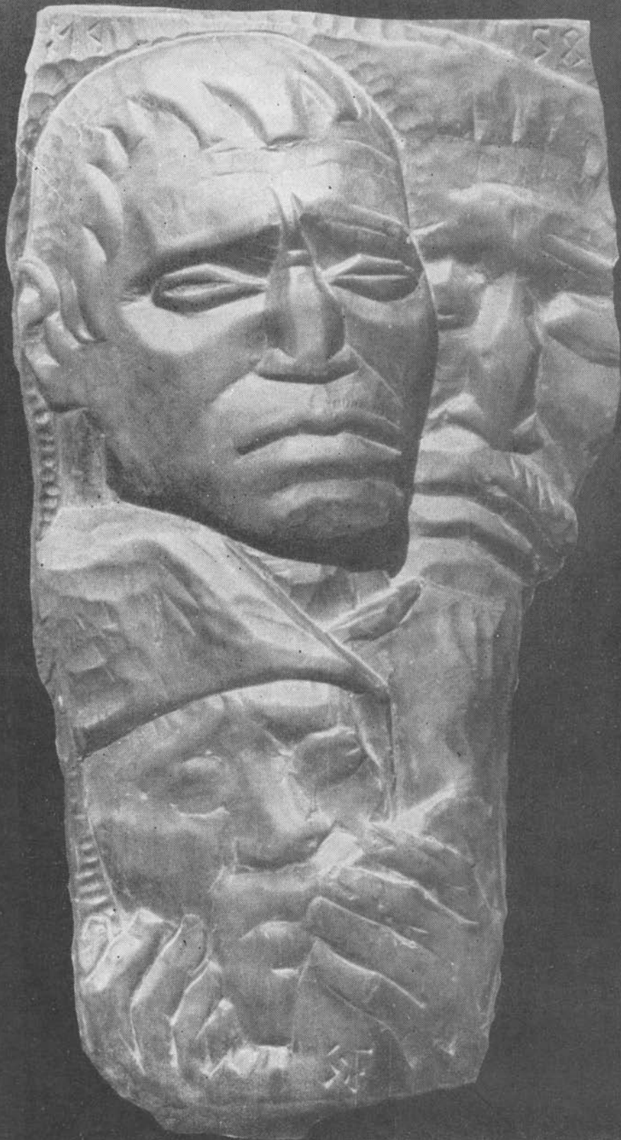
SZERVÁTIUSZ TIBOR: Dózsa népe (1958)