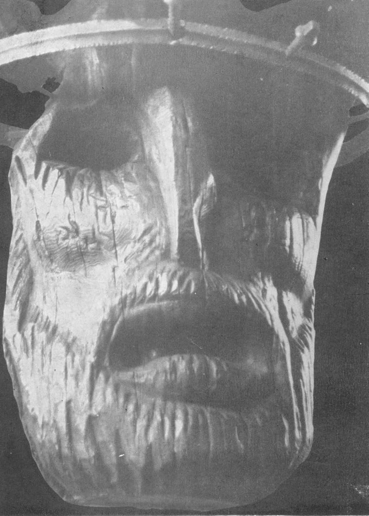
SZERVÁTIUSZ TIBOR: Dózsa halála (részlet, 1967)