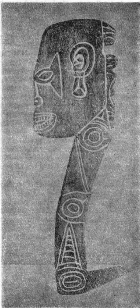
Táncjelvény Gingala szigetéről

A népi világból meríteni sokféleképp lehet. Korszakok és nagy egyéniségek ábrázolták demokratikus eszméktől fűtve a nép életét. Mások, képzőművészekről lévén szó, a népművészet kincseiből csak a pusztá formát kísérelték meg az egyetemes művészet világába iktatni. Ez a szemlélet a XX. században találkozott