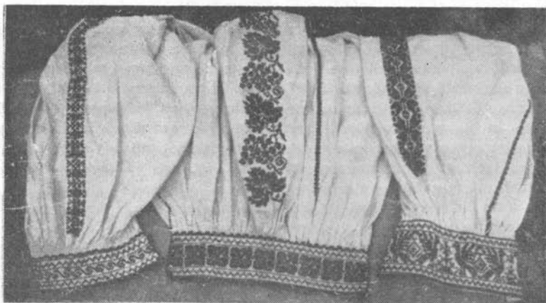
Leányingkézelő- és ujjminták

A népviselet elhagyását általában az iparosodásnak szokás tulajdonítani, érdekes azonban, hogy a hímesingek elhagyása után még fél évszázadig, a II. vi-