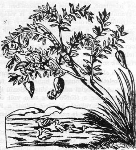
„Liba-fa“ (középkori rajz)

A mikroorganizmusok felfedezése újabb lehetőségeket biztosított az autogenezis hívei számára. Habár Lazaro Spallanzani kísérletei alapján még a XVIII. században arra a következtetésre jutott, hogy a mikroorganizmusok körében sem lehetséges autogenezis, nagyon sok biológus maradt e téves elmélet híve. A múlt század közepe táján meglehetősen hevessé vált a vélemények harca a spontán genezis körül. Pouchet több cikket, majd 1859-ben egy 700 lapnyi tanulmányt közölt. Ezekben saját