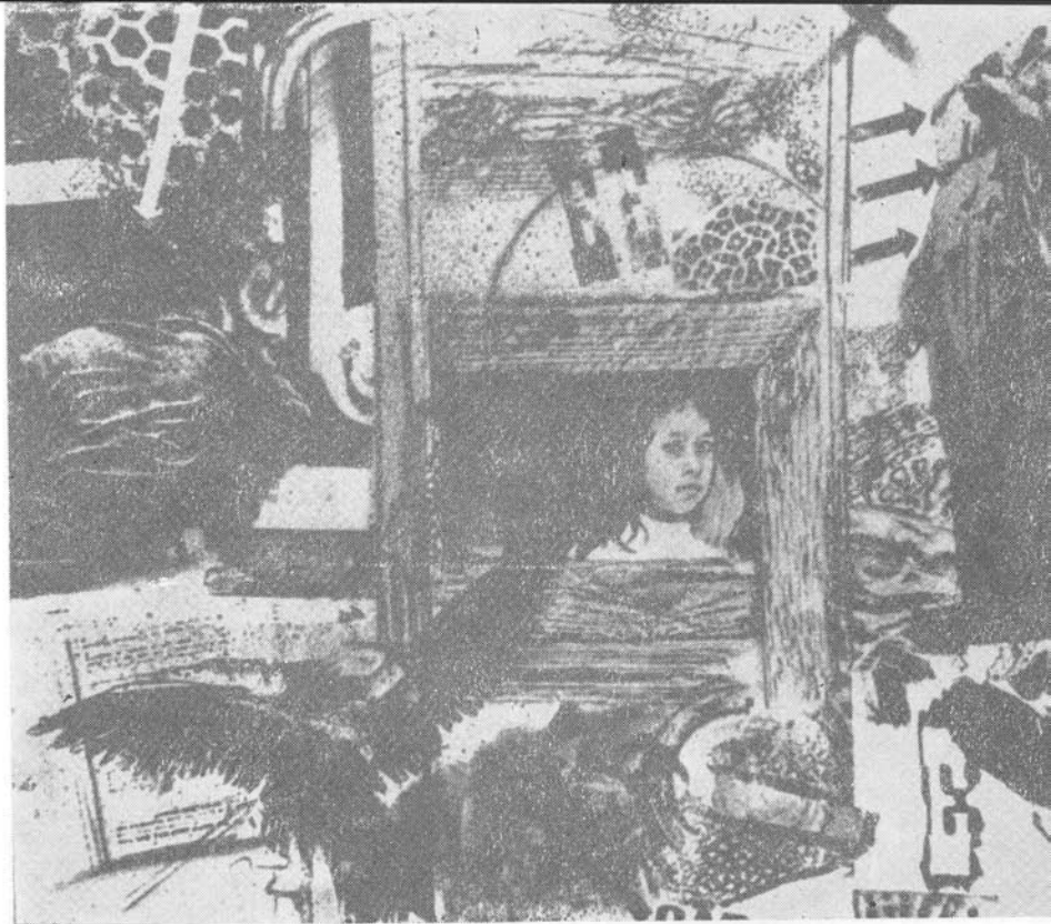
1. Lakner László: Ablakok