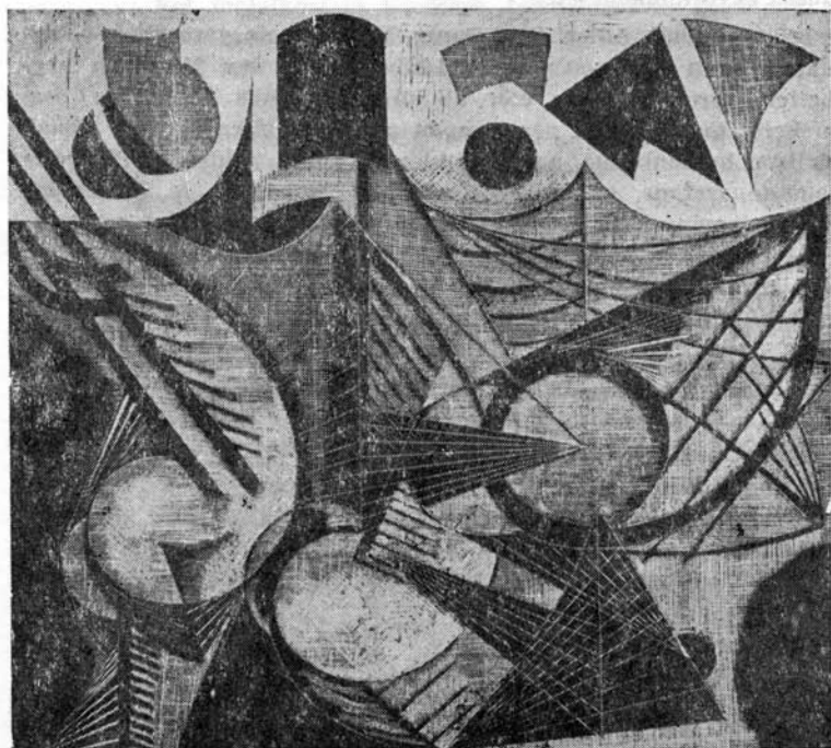
Kazinczy Gábor grafikája: