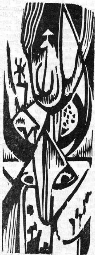
Makkai Piroska metszete

Az Új Szó című torontói magyar újság számos felvételt közöl a szobor leleplezésről. Feltűnő az ünnepen szereplő fiatalság ragaszkodása a népviselethez.