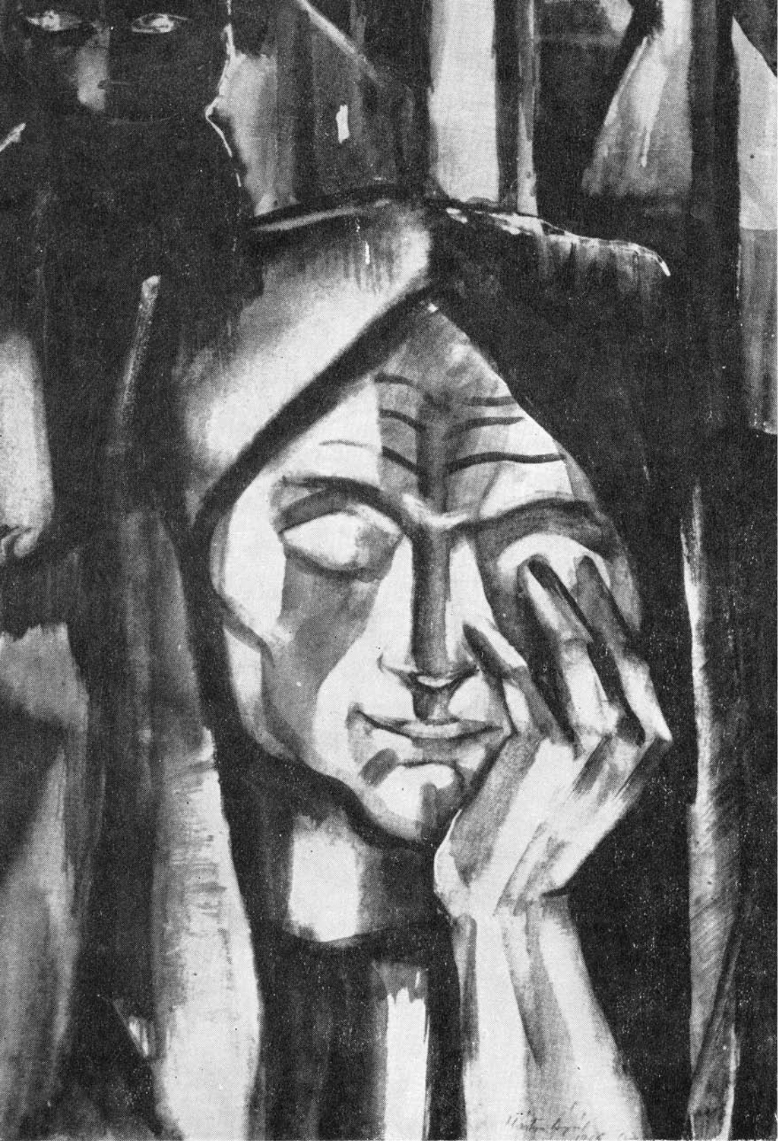
Márton Árpád: Tél