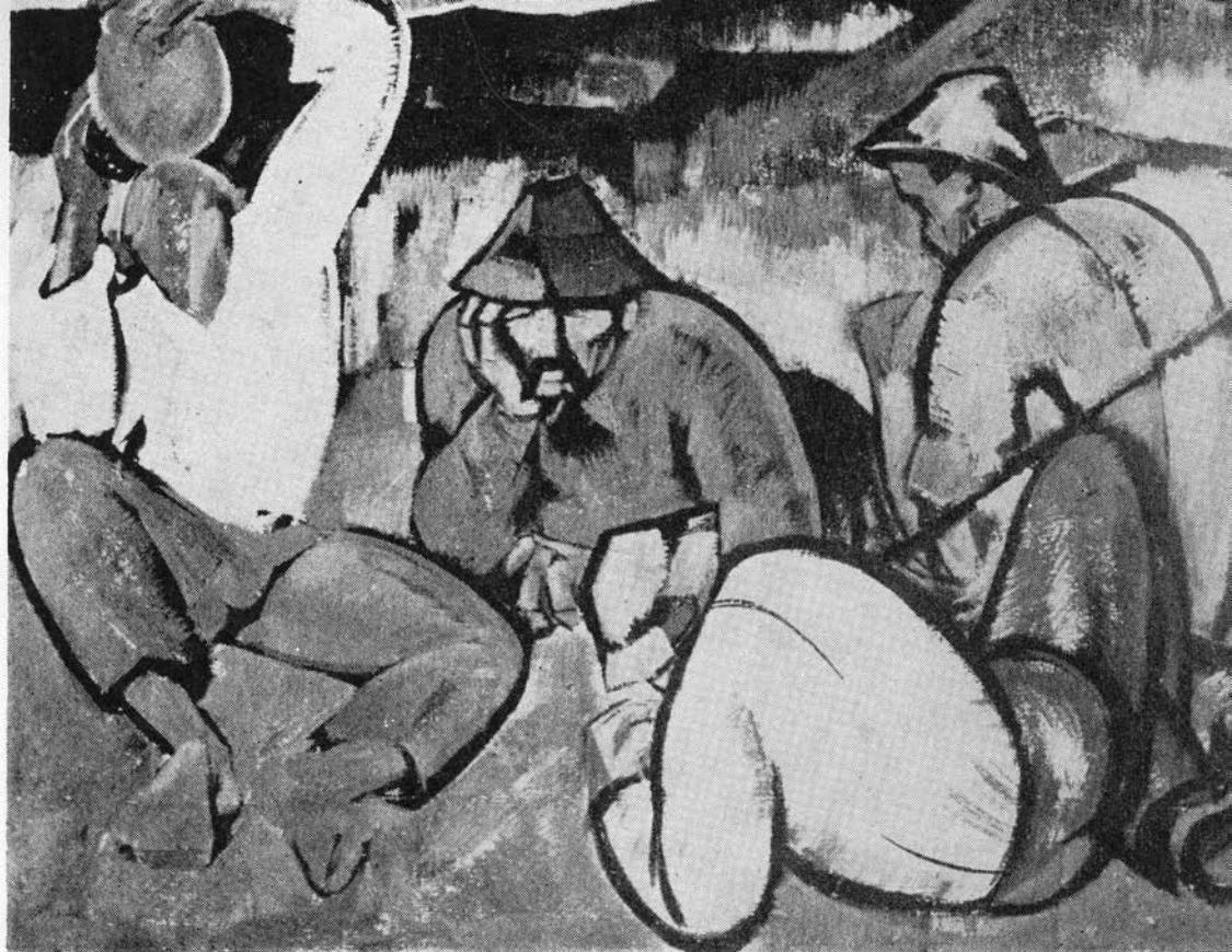
CSÍKSZEREDAI FIATALOK MUNKÁIBÓL