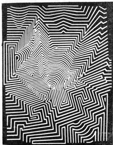
Victor Vasarely: Transzparencia