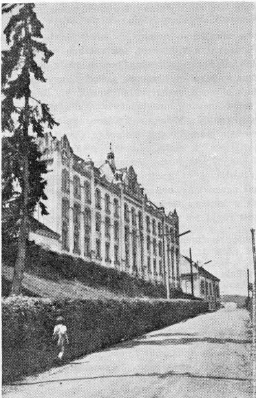
A székelyudvarhelyi Dr. Petru Groza Líceum

Az oktatói-nevelői munka eredményeképpen sok, a társadalom számára hasznos ember került ki az iskolából. Egyesek közülük a tudományban, mások az irodalom terén tűntek ki. Megemlítjük Baróti Szabó Dávidot, a deák-