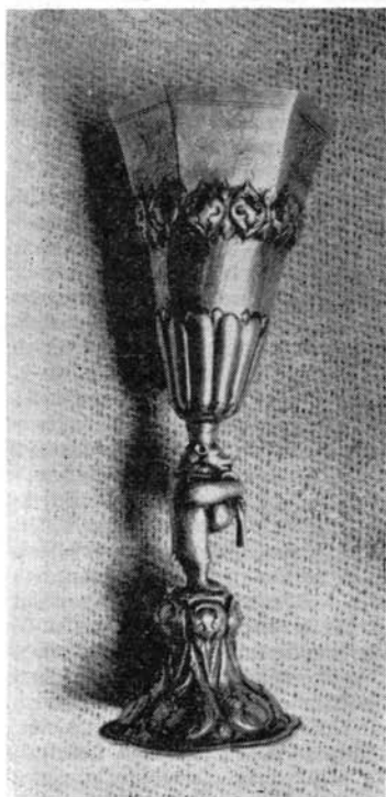
Késő reneszánsz—kora barokk kehely, Nagykadács

Az első években az idegkörtan mellett endokrinológiai, biokémiai, hepatológiai, embriológiai, növénybiológiai kérdésekkel, valamint a szilikózis problémájával is foglalkoznak az új intézmény munkatársai. Hamar világossá válik azonban, hogy ez a túl széles körű tevékenység az erők szétforgácsolásához