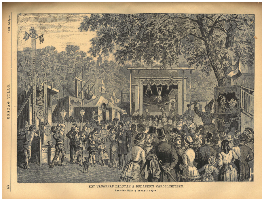
2. kép. Szendrői Miklós: Egy vasárnap délután a budapesti Városligetben

A cikkből kiderül, hogy a mutatónyosok többsége továbbra is inkább a német nyelvet használja, és a közönségről is olvasható egy sommás megállapítás: „[...] publikumát legnagyobb részt az alsóbb polgár- és katona-osztály szolgáltatja”. 43