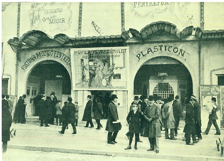
3. kép. A Fortuna Mozcófényképszínház és a Plasticon a városligeti Vurstliban

Forrás: Tavasz nyitány. Bálint János felvétele. Élet 1911. március 19. 319.