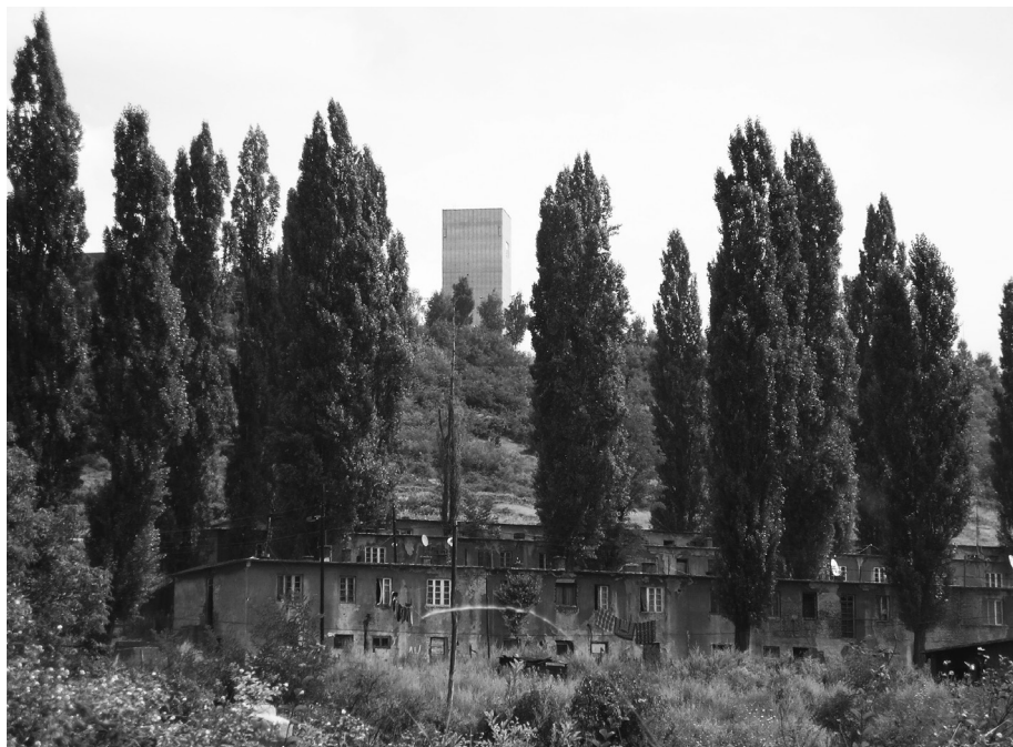
2. kép. A Berlin tábor helye ma (2007). A képen látható épületek helyén voltak a fabarakkok. A kisegyházak barakkja a mai bányatorony alatt volt.