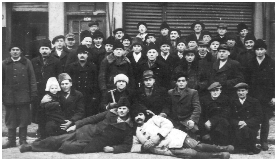
6.kép. Jehova Tanúinak egy csoportja Borban