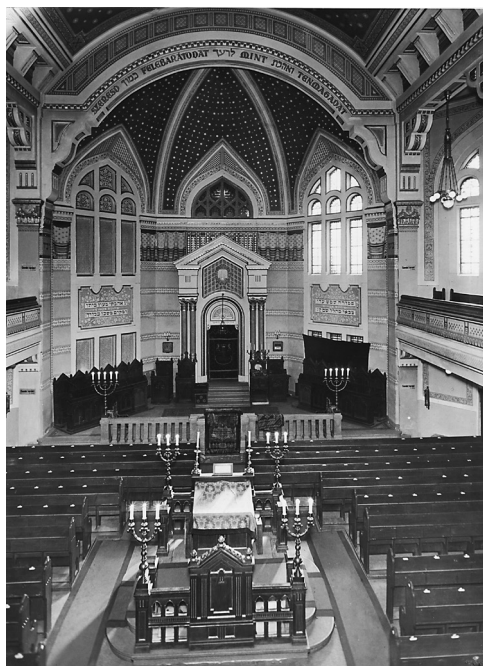
5. kép. A zsinagóga belső tere