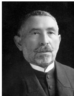
2. kép. Dr. Farkas József (1927)

Körzette alakulása után kilenc hónappal a közösség végül úgy döntött, „hogy a Páva utcai imaház helyén ezeröttszáz férőhelyes templomot” 25 épít nagyrészt közadakozásból – az alapkövet 1921 novemberében tették le. 26 Az építkezés során, 1923 késő őszén az Ébredő Magyarok Egyesülete bombatámadást kísérelt meg a zsinagóga ellen, de a bomba nem robbant fel. 27 Miközben a tetteseket a rendőrségen vallatták, 1924. január 6-án felavatták a Baumhorn Lipót által tervezett épületet. A felavatási ünnepségen nem kizárólag a pesti zsidóság vett részt, de keresztény egyházi vezetők is jelen voltak. Feltehetőleg a közelmúlt eseményeire is reflektálva Zahler Emil elnök az új zsinagóga béketemplom funkcióját hangsúlyozta: „Legyen ez a templom, aminek terveztek: a békének temploma, a megértés áradjon innen minden felekezet részére. [...] Aki belép ide, hogy imádkozzék, az tudja meg, hogy Isten közöttünk van. [...] Mindannyitokat arra kérlek, hogy mondjuk el a legszentebb imádságot: Hiszek egy Istenben, Hiszek egy hazában, Hiszek egy isteni örök igazságban, Hiszek Magyarország feltámadásában.” 28