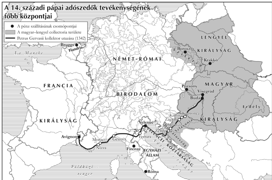
1. térkép